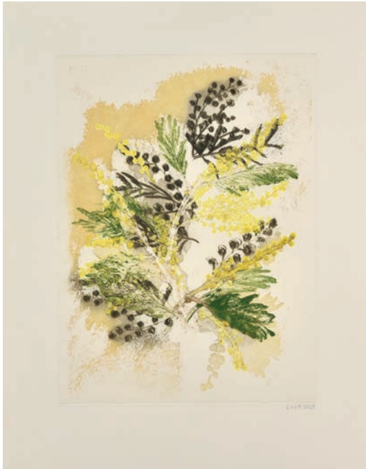
Eloïse Van der heyden Mimosa , 2020 monotype 53,8 x 42 cm | 15 variations 900 €