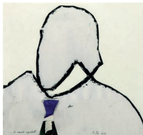
Pierre Buraglio La cravate improbable , 2014 impression pigmentaire et collage 29,5 x 32 cm | 15 ex 550 €