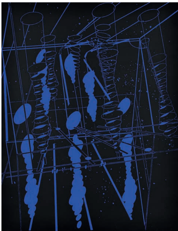
Bernard Moninot Antichambre , 2018 collagraphie sur papier 65 x 50 cm | 15 ex 600 €