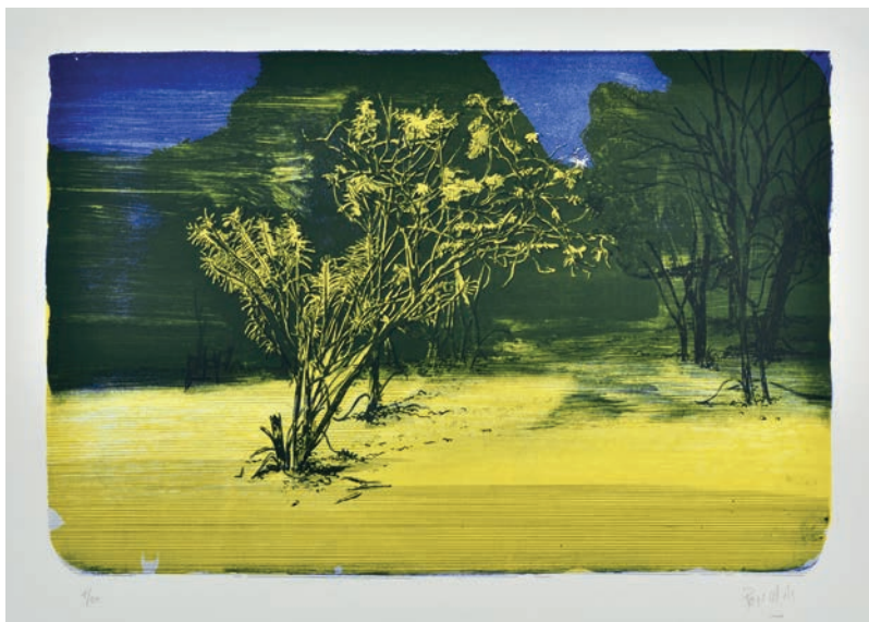
Frédéric Poincelet sans titre , 2017 lithographie 42 x 57,5 cm | 20 ex 400 €