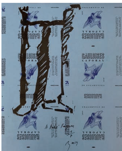
Pierre Buraglio À André Fougeron , 2019 linogravure sur papier imprimé Gauloises 24 x 19,5 cm | 7 ex 450 €