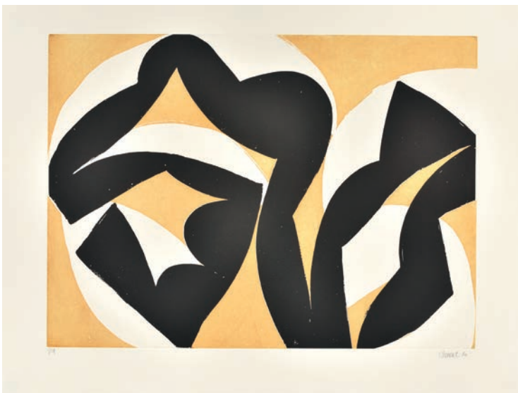
Alain Clément Sans titre , 2020 aquatinte 50 x 66,5 cm | 19 ex 600 €