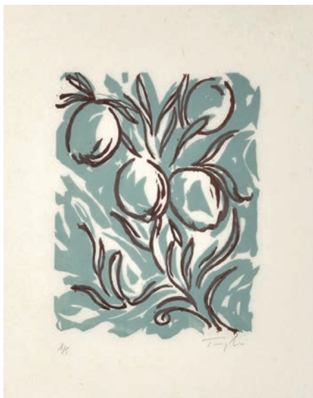
Gérard Traquandi Réjouis-toi ... , 2020 xylographie 25 x 15 cm | 5 ex 400 €