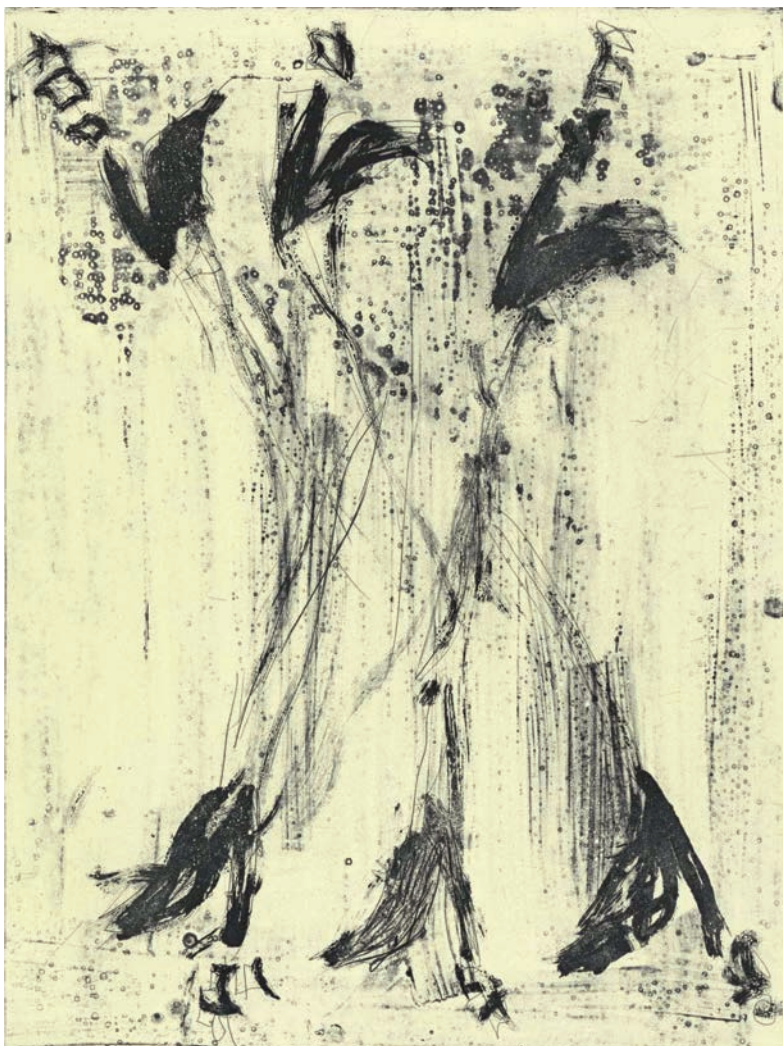
Georg Baselitz Ich höre Stimmen , 2015 eau-forte au trait et aquatinte 85,5 x 64,5 cm | 10 ex 5 000 €