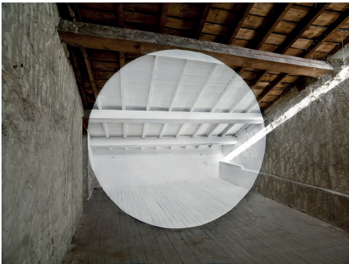
Georges Rousse Bourgoin Jallieu , 2019 épreuve pigmentaire 92 x 112 cm | 30 ex 3 200 €