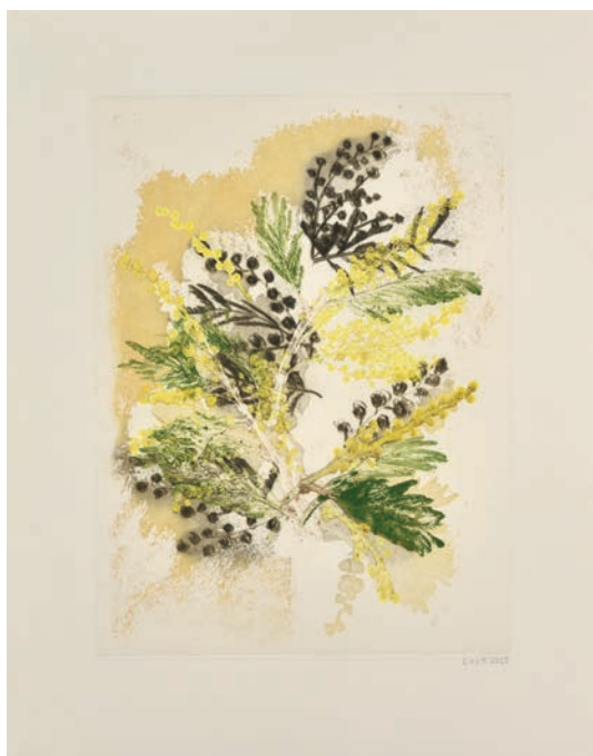
Eloïse Van der heyden Mimosa , 2020 monotype 53,8 x 42 cm | 15 variations 900 €