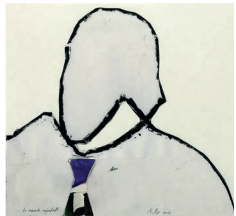
Pierre Buraglio La cravate improbable , 2014 impression pigmentaire et collage 29,5 x 32 cm | 15 ex 550 €