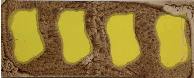
Claude VIALLAT Sans titre , 2015 monotype à encrage sérigraphique 20 x 48 cm | 30 variations 1 600 € (chaque)