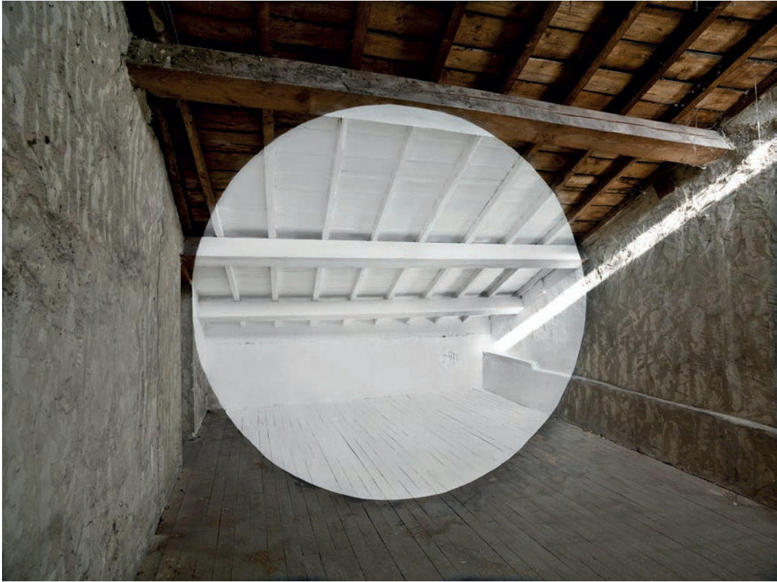
Georges Rousse Bourgoin Jallieu , 2019 épreuve pigmentaire 92 x 112 cm | 30 ex 3 200 €