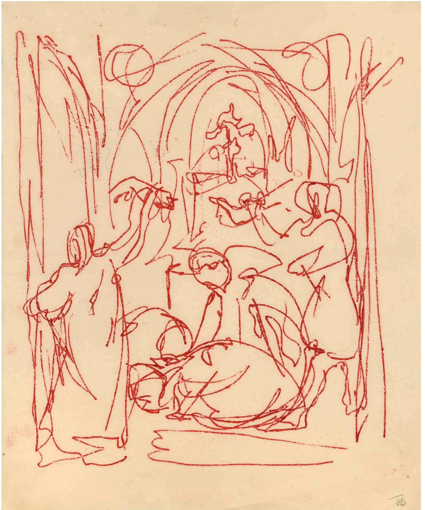
Gérard Traquandi Sans titre , 2023 | report à l'huile | 50 x 32,5 cm