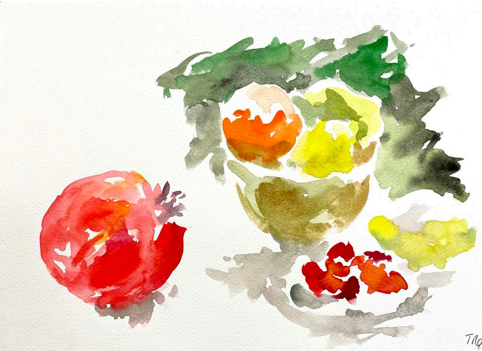
G rard Traquandi Sans titre , 2023 | aquarelle sur papier | 25 x 37,7 cm