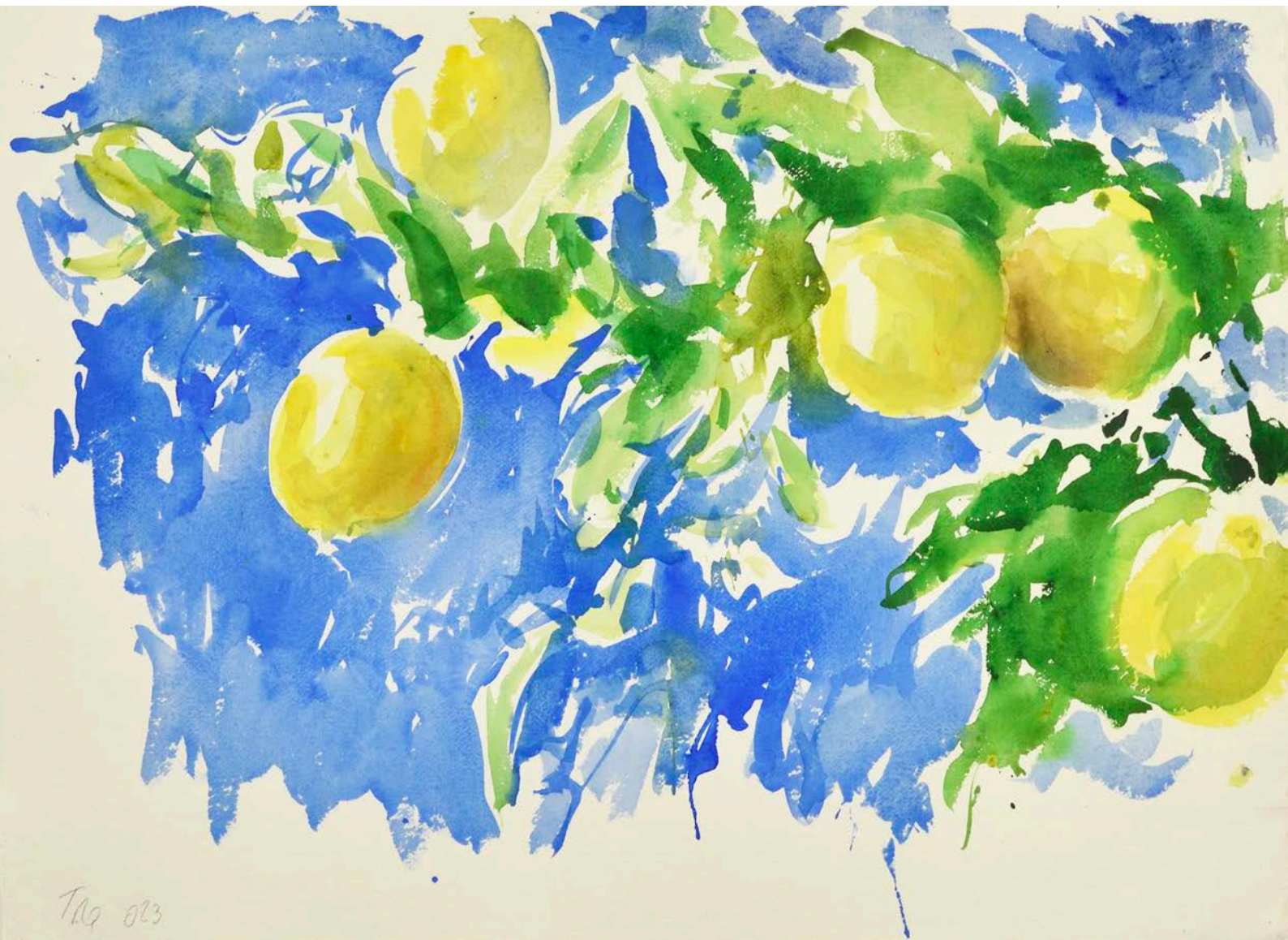
G rard Traquandi Sans titre , 2023 | aquarelle sur papier | 57,5 x 77 cm