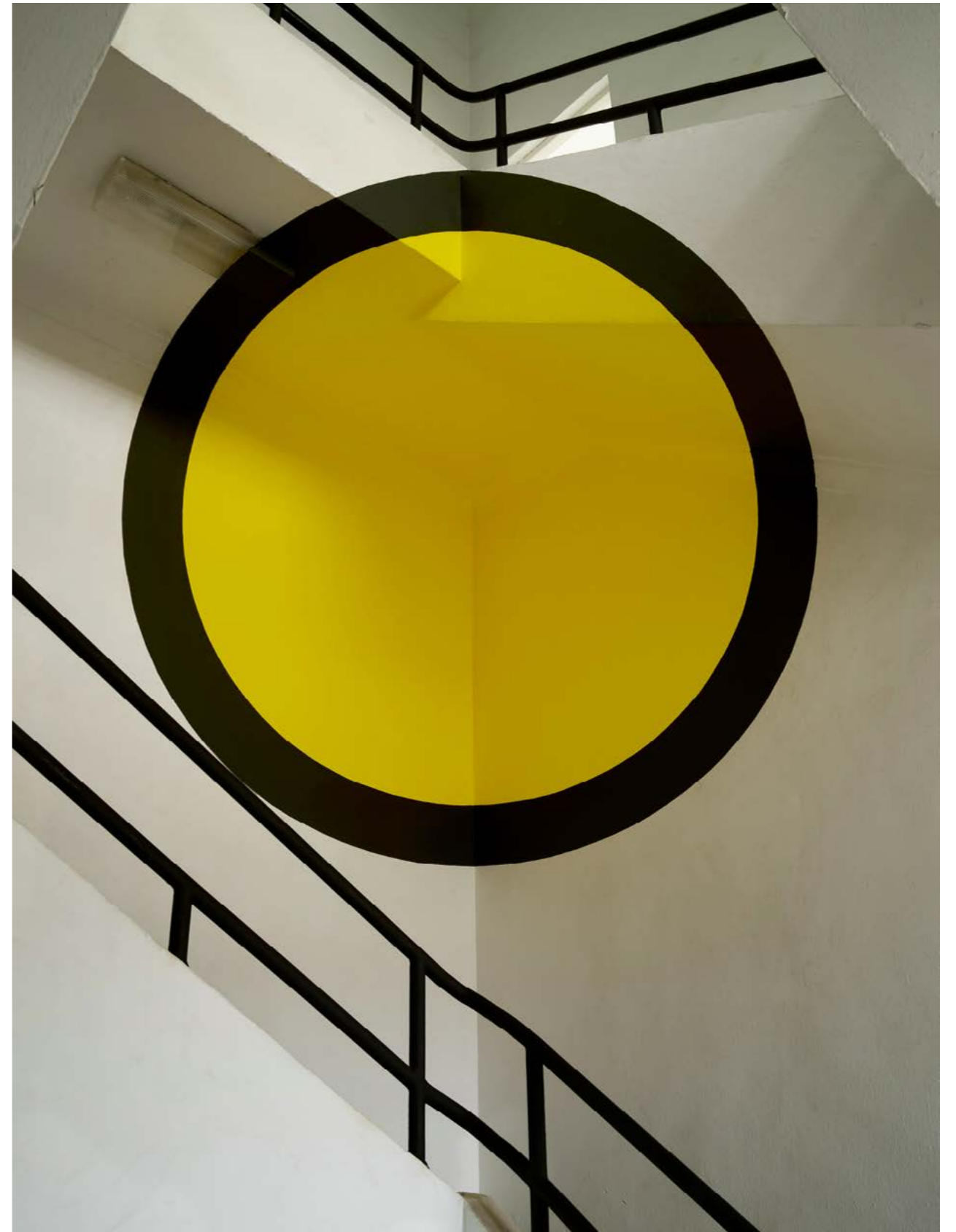
Georges Rousse Bilbao , 2023 | impression jet d'encre sur hahnemühle | 145 x 115 cm