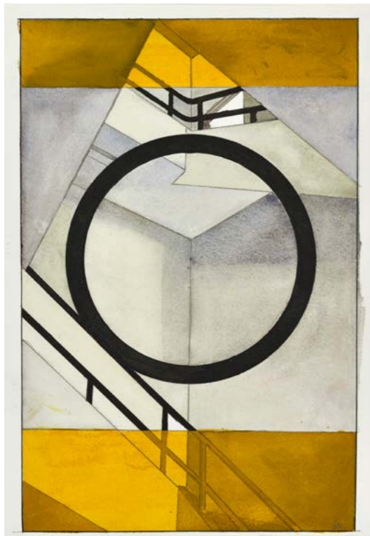
Georges Rousse Bilbao #2 , 2023 | aquarelle, graphite et encre sur papier | 38,6 x 25 cm

This exhibition is organised in partnership with the gallery as part of Photo Days.