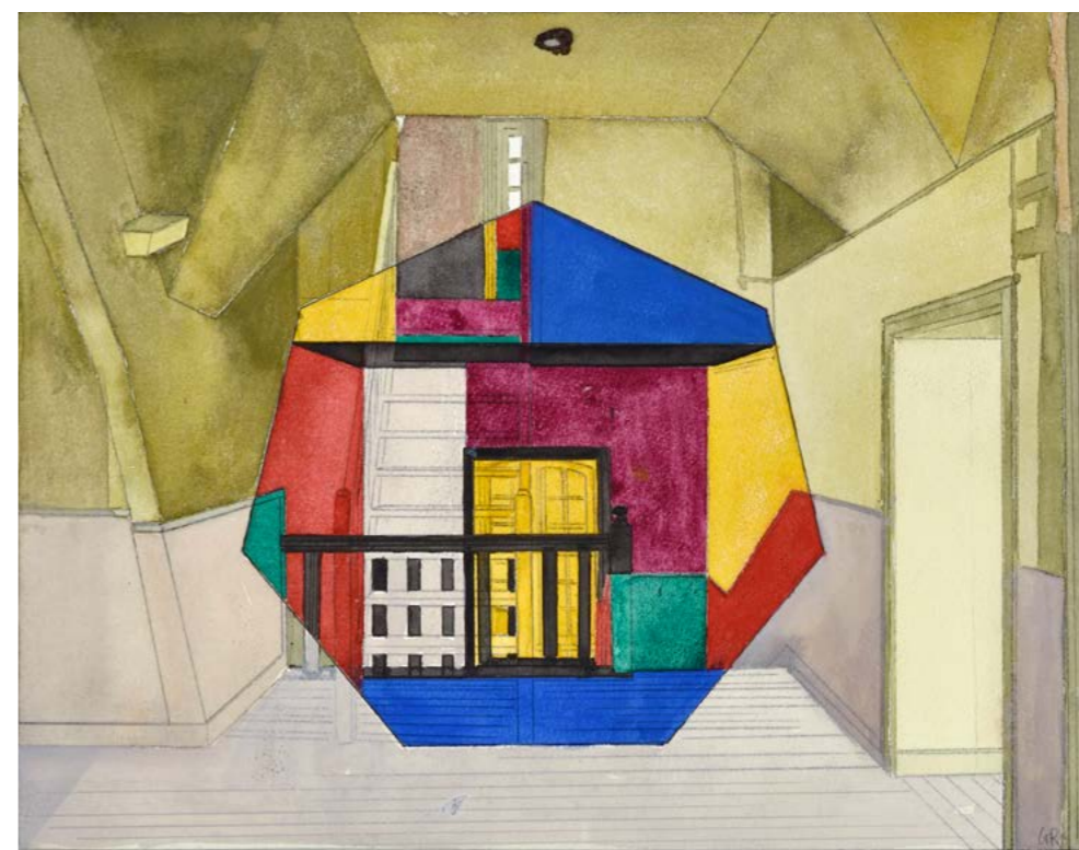
Georges Rousse Cancale , 2023 | aquarelle et graphite sur papier | 29,5 x 37,5 cm