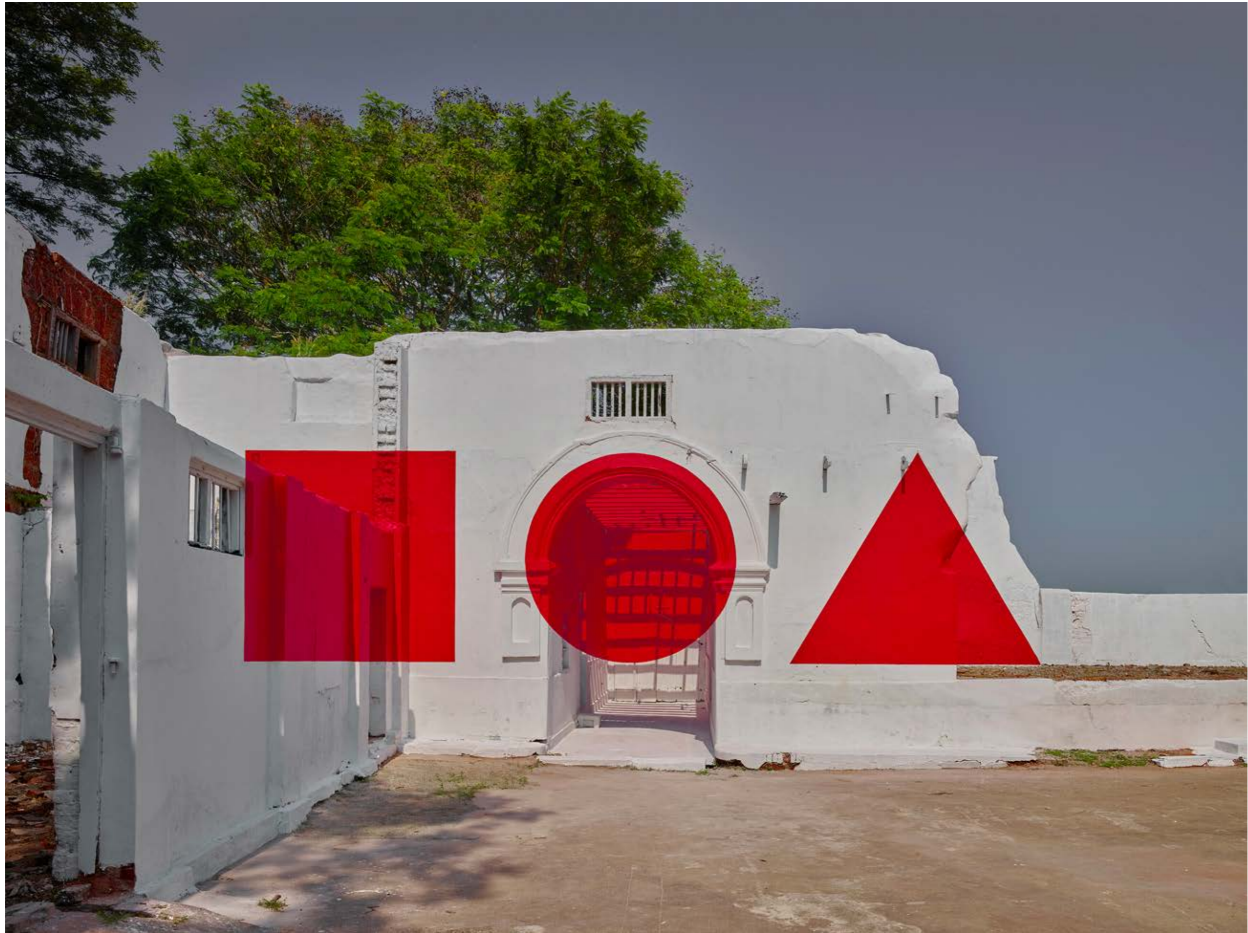
Georges Rousse Kochi , 2018 | impression jet d'encre sur hahnemühle | 115 x 145 cm