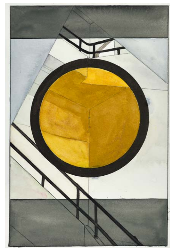
Georges Rousse Kochi , 2018 | aquarelle, graphite et encre sur papier | 27,3 x 36,6 cm