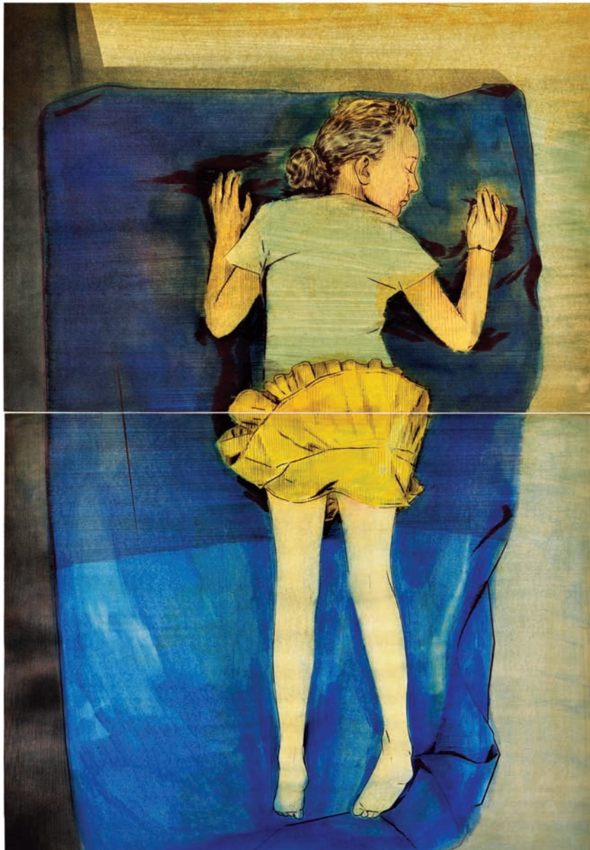
Frédéric Poincelet «Karin Mamma Andersson», 2018 stylo à bille et encre de couleur sur papier - 104 x 65 cm

40, rue Quincampoix 75004 Paris | 1 er étage T. +33 1 45 55 23 06 | Du mardi au samedi de 14 à 19 heures et sur rendez-vous contact@catherineputman.com | catherineputman.com