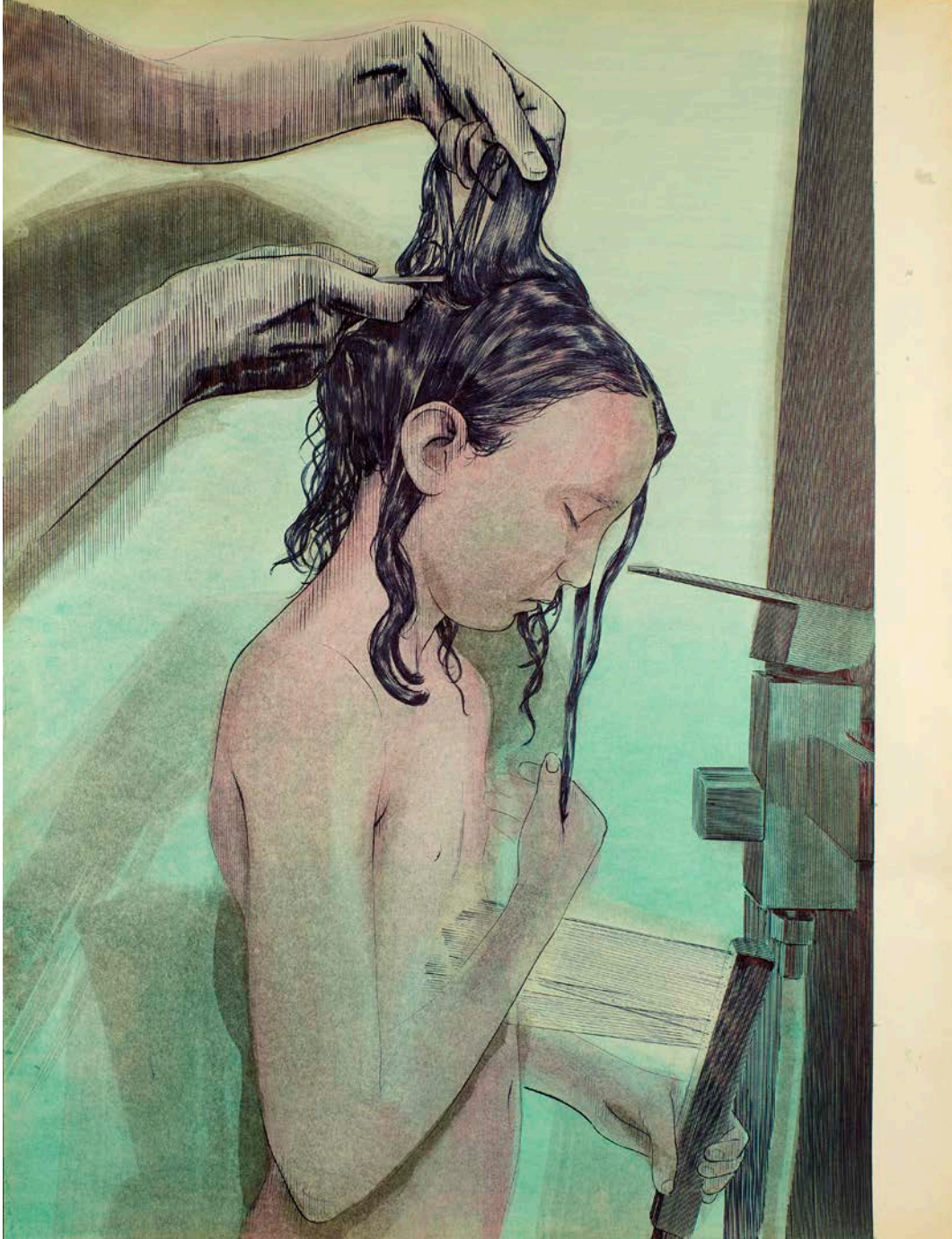
Frédéric Poincelet « Jean-Pierre Le Boul'ch », 2018 stylo à bille et encre de couleur sur papier - 65 x 50 cm