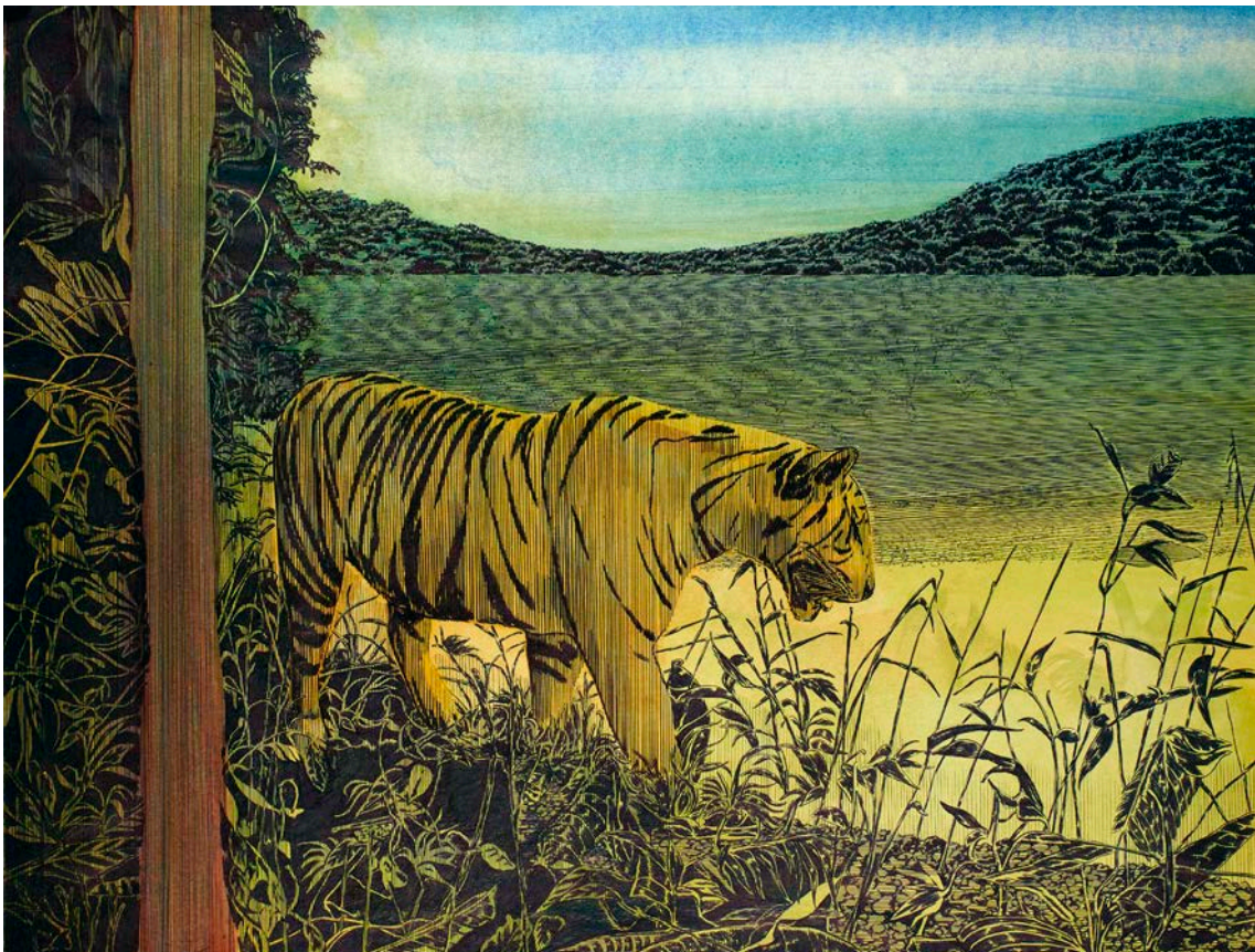
Frédéric Poincelet « Gilles Aillaud », 2018 stylo à bille et encre de couleur sur papier - 50 x 65 cm