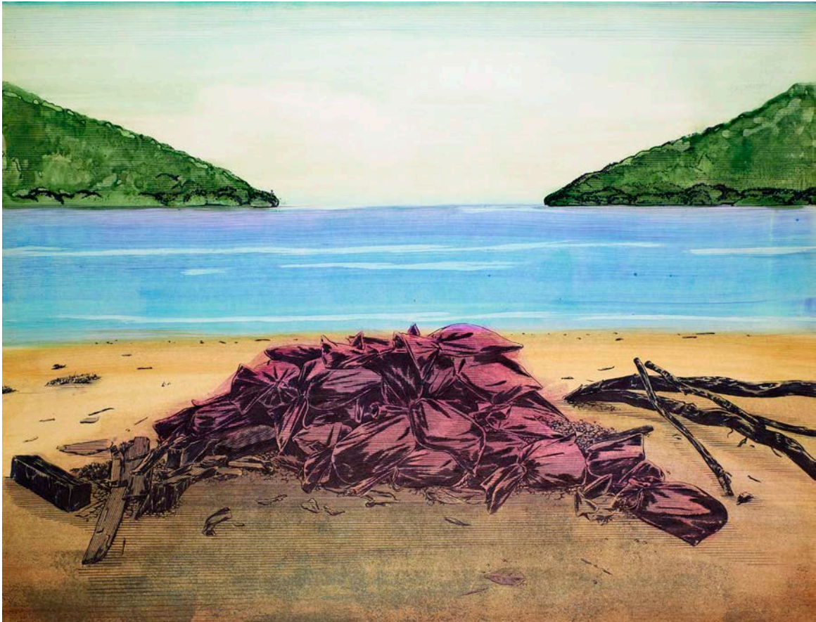
Frédéric Poincelet « Daniel Pitin », 2018 stylo à bille et encre de couleur sur papier - 50 x 65 cm