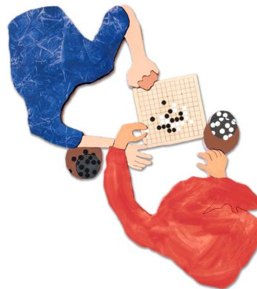
Rob Miles Learning Go 2022, huile sur bois découpé, 25 x 42 cm