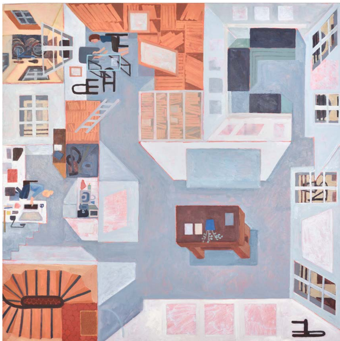
Rob Miles La galerie 2022, huile sur bois, 60 x 60 cm, Courtesy Galerie Catherine Putman