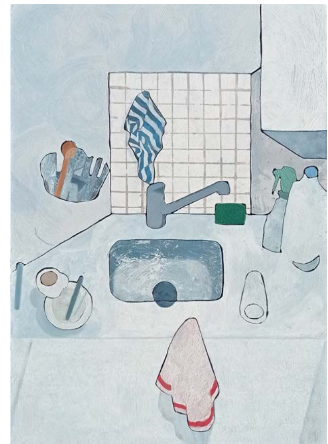
Rob Miles Kitchen in Hyeres 2022, huile sur bois decoupé, 30 x 20 cm, Courtesy Galerie Catherine Putman