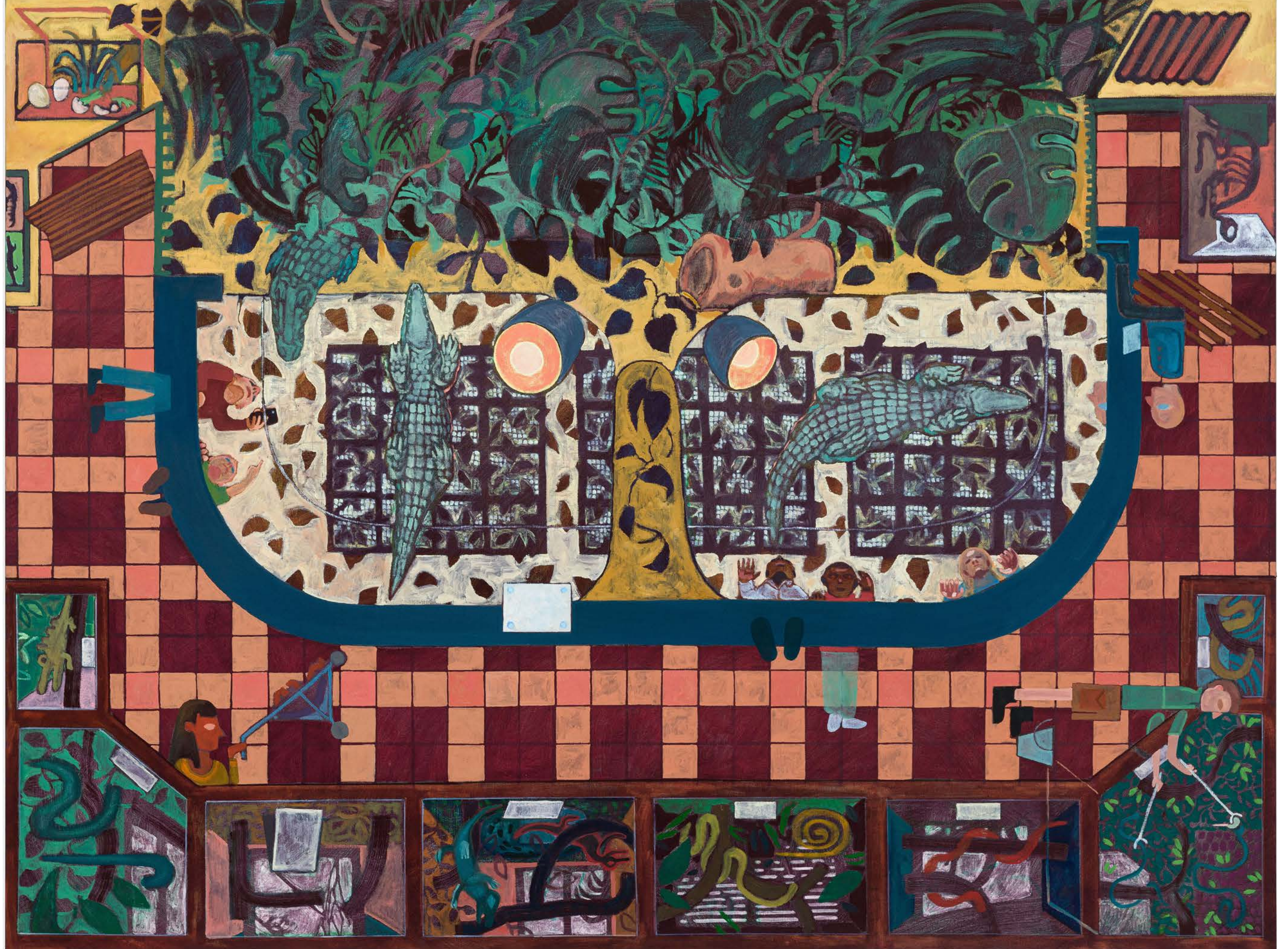
Rob Miles Crocodile Enclosure 2021, huile sur toile, 160 x 213 cm, Courtesy Galerie Catherine Putman (photo Romain Darnaud)