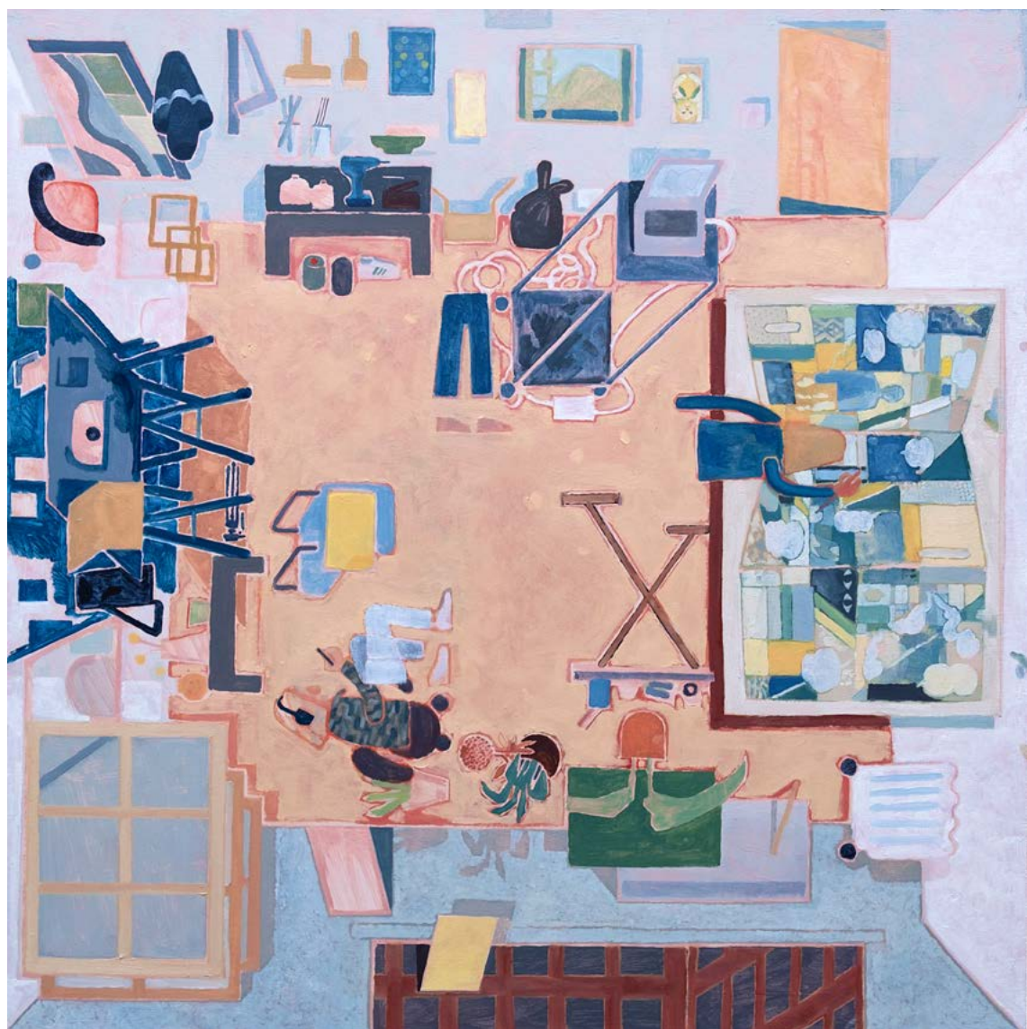
Rob Miles L'atelier de Pierre 2022, huile sur bois, 60 x 60 cm