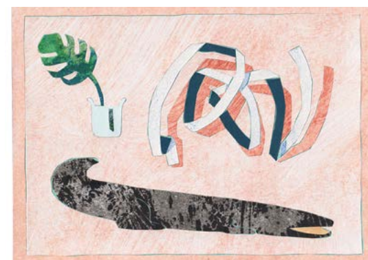
Rob Miles Notes on a crocodile 2022, collage, 15 x 21 cm, Courtesy Galerie Catherine Putman