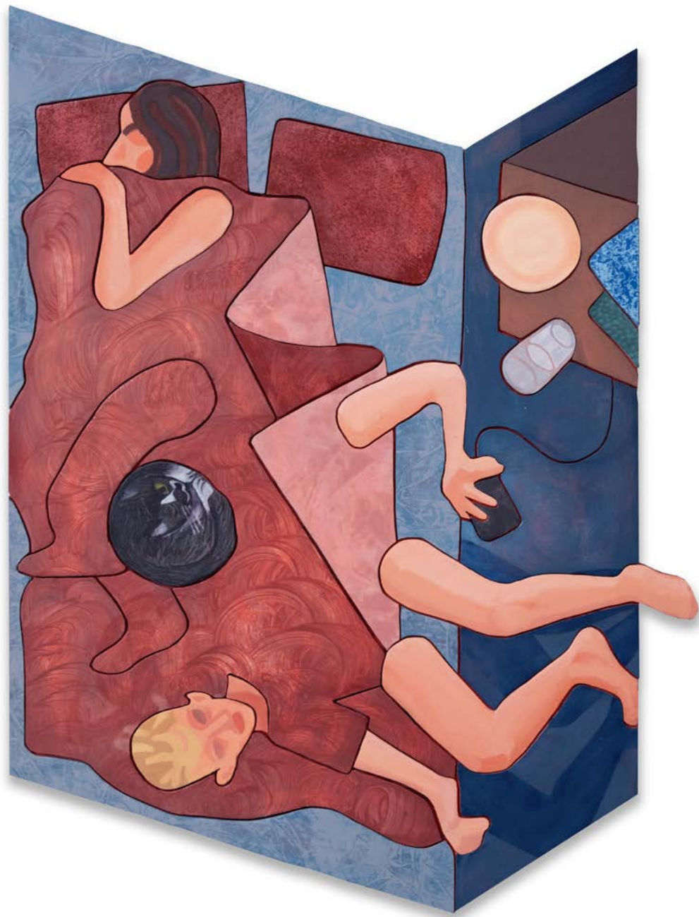
Rob Miles Early In The Morning 2022, huile sur bois decoupé, 60 x 80 cm