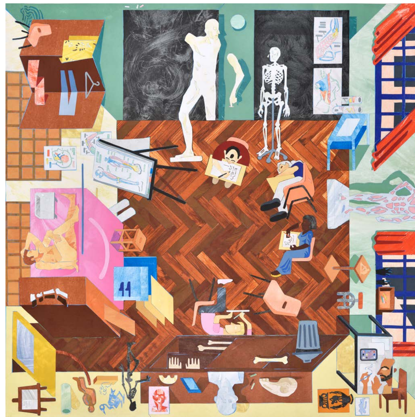
Rob Miles Cours de morphologie 2022, collage, 80 x 80 cm, Courtesy Galerie Catherine Putman

*Rob Miles & Les Clés Anglaises : auteur-compositeur-interprète, à la guitare et au chant, Rob Miles est rejoint par son groupe de musicien.ne.s comprenant clarinette, contrebasse, batterie, piano, scie musicale, et harmonies vocales. Ensemble, ils donnent vie à ses compositions inspirées de la country, du blues et de la soul, dans une performance énergique et éclectique.