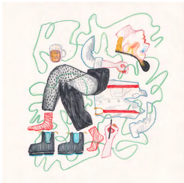
Rob Miles In a tangle , 2019 | crayon aquarelle sur papier | 20 x 20 cm