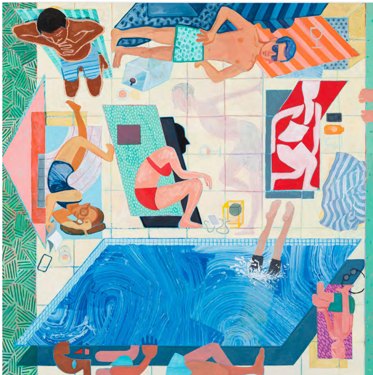
Rob Miles Les Baigneurs , 2021 | huile sur toile| 160 x 160 cm