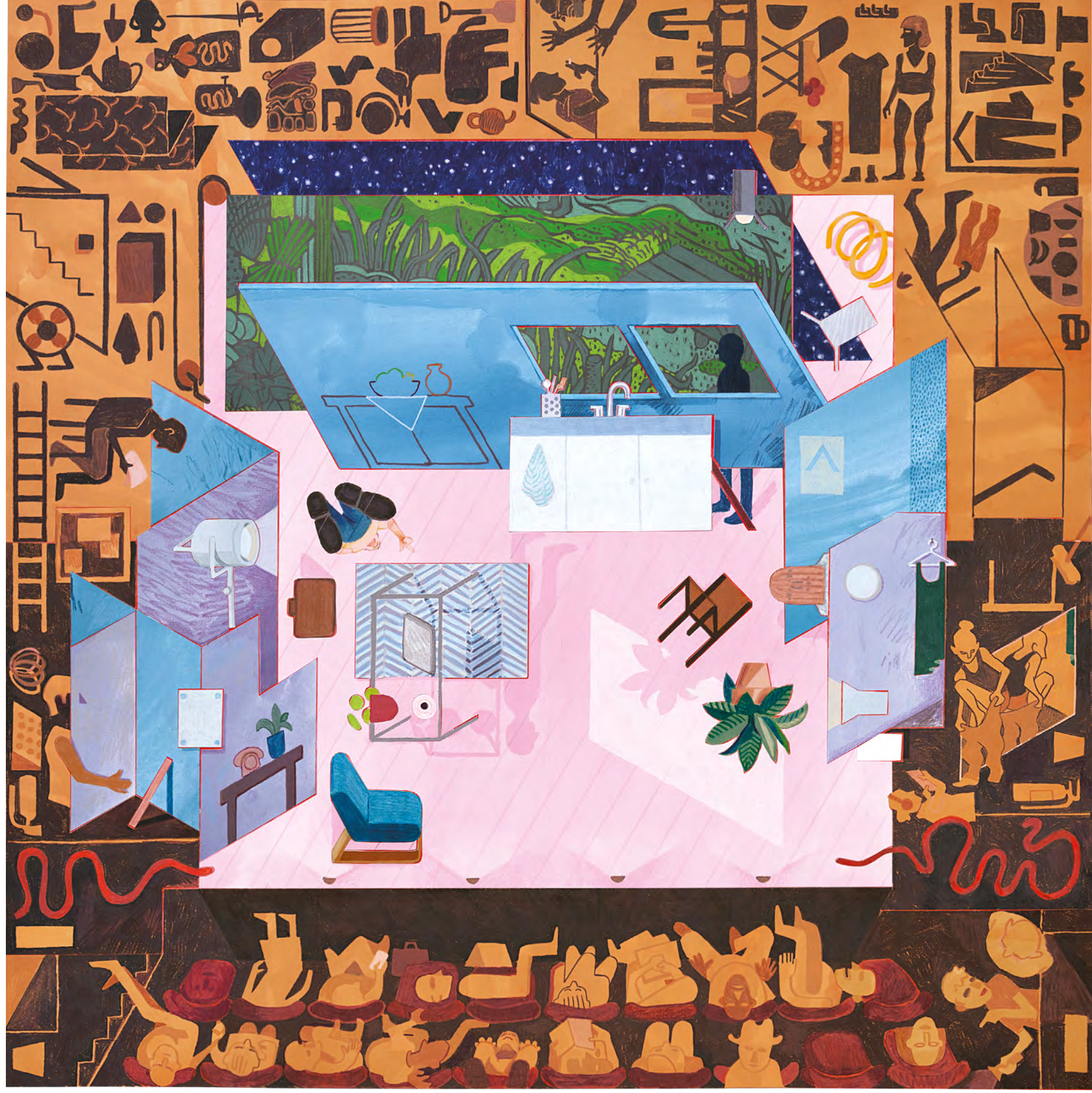
Rob Miles Act II , 2022 | collage, encre, crayon de couleur | 75 x 75 cm