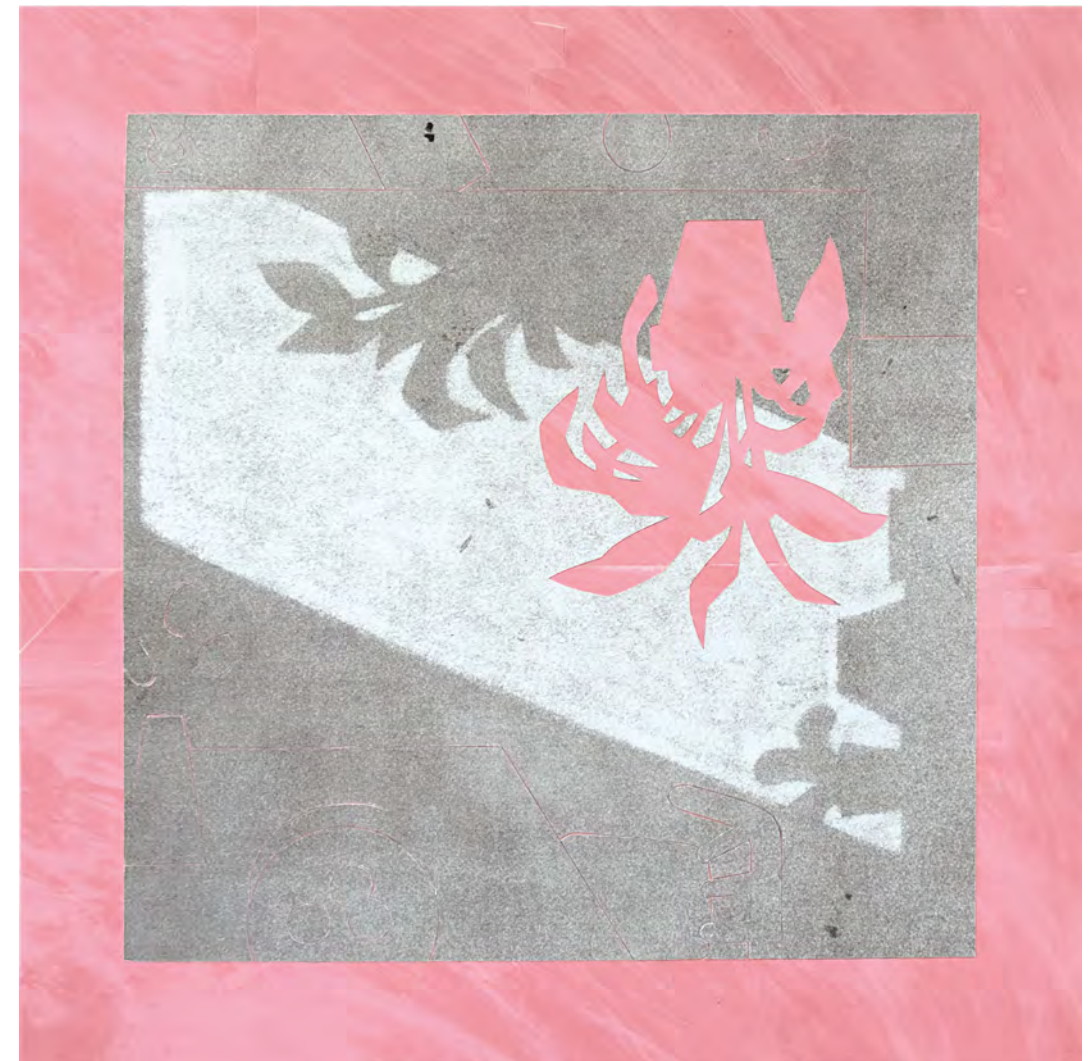
Rob Miles Detail (Kitchen) II , 2022 | collage | 40 x 40 cm