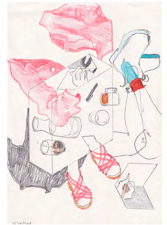
Rob Miles Gathering Thoughts , 2020 | crayon aquarelle et graphite sur papier | 15 x 21 cm