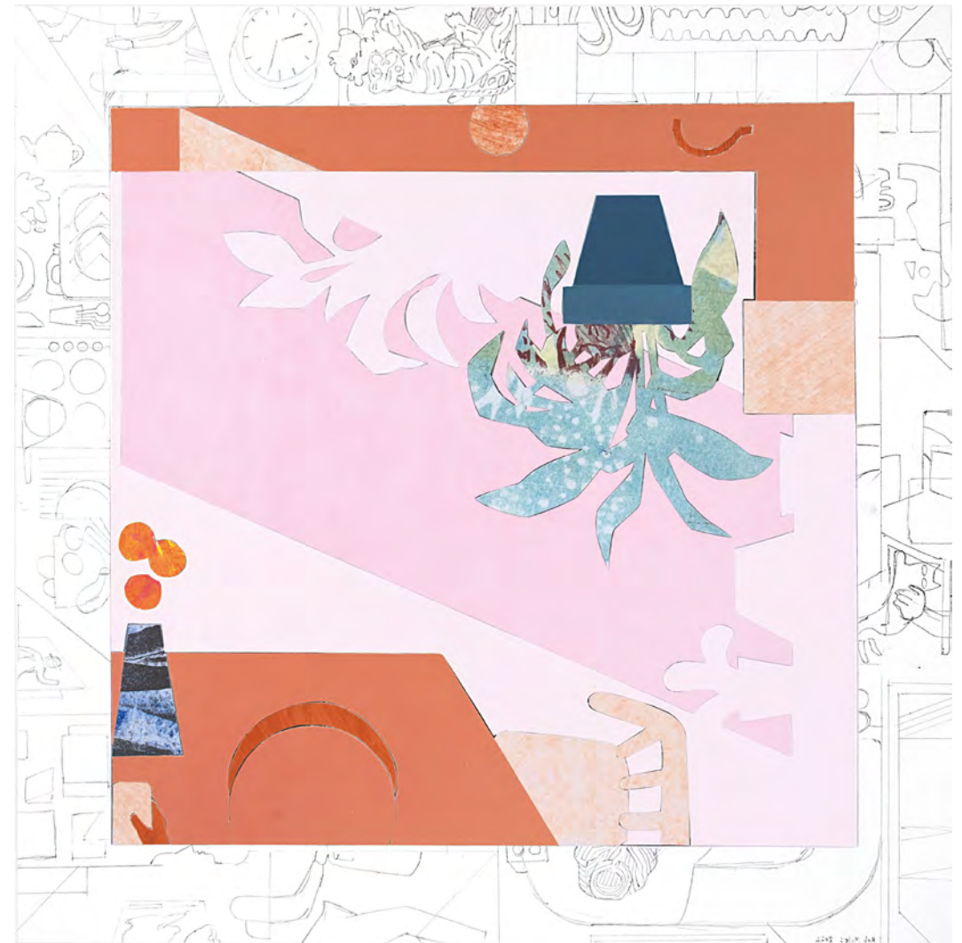
Rob Miles Detail (Kitchen) IV , 2022 | collage | 40 x 40 cm