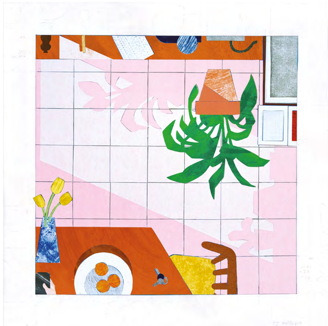
Rob Miles Detail (Kitchen) , 2022 | collage | 40 x 40 cm