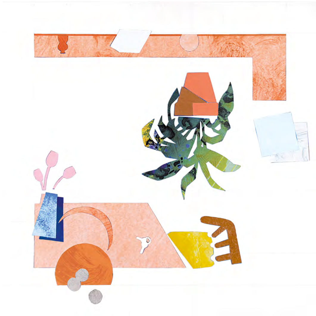
Rob Miles Detail (Kitchen) III , 2022 | collage | 40 x 40 cm