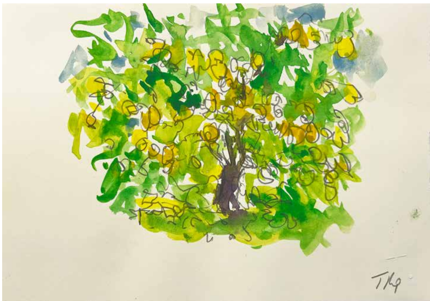
Gérard Traquandi Citronnier , 2025 aquarelle et graphite sur feuille de carnet | 12,5 x 20,5 cm 1 700 €