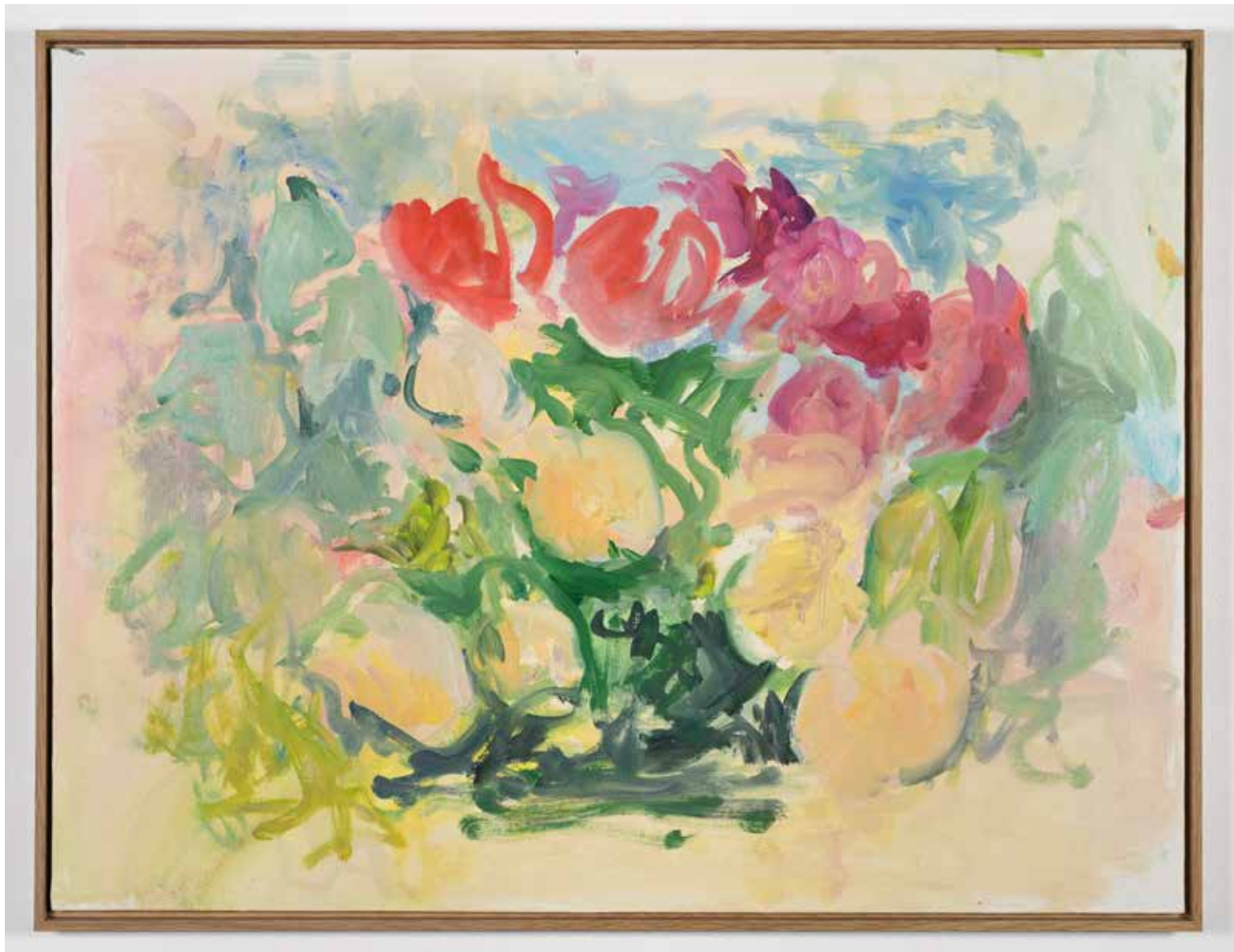
Gérard Traquandi Sans titre (Les fleurs) , 2025 huile sur carton entoilé | 66 x 50 cm 11 500 €