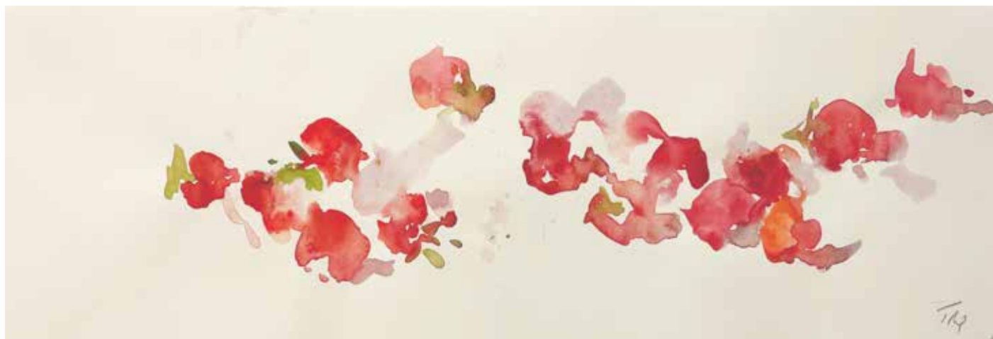
Gérard Traquandi Sans titre (fraises #3) , 2025 aquarelle sur feuilles de carnet | 14 x 41 cm 2 800 €