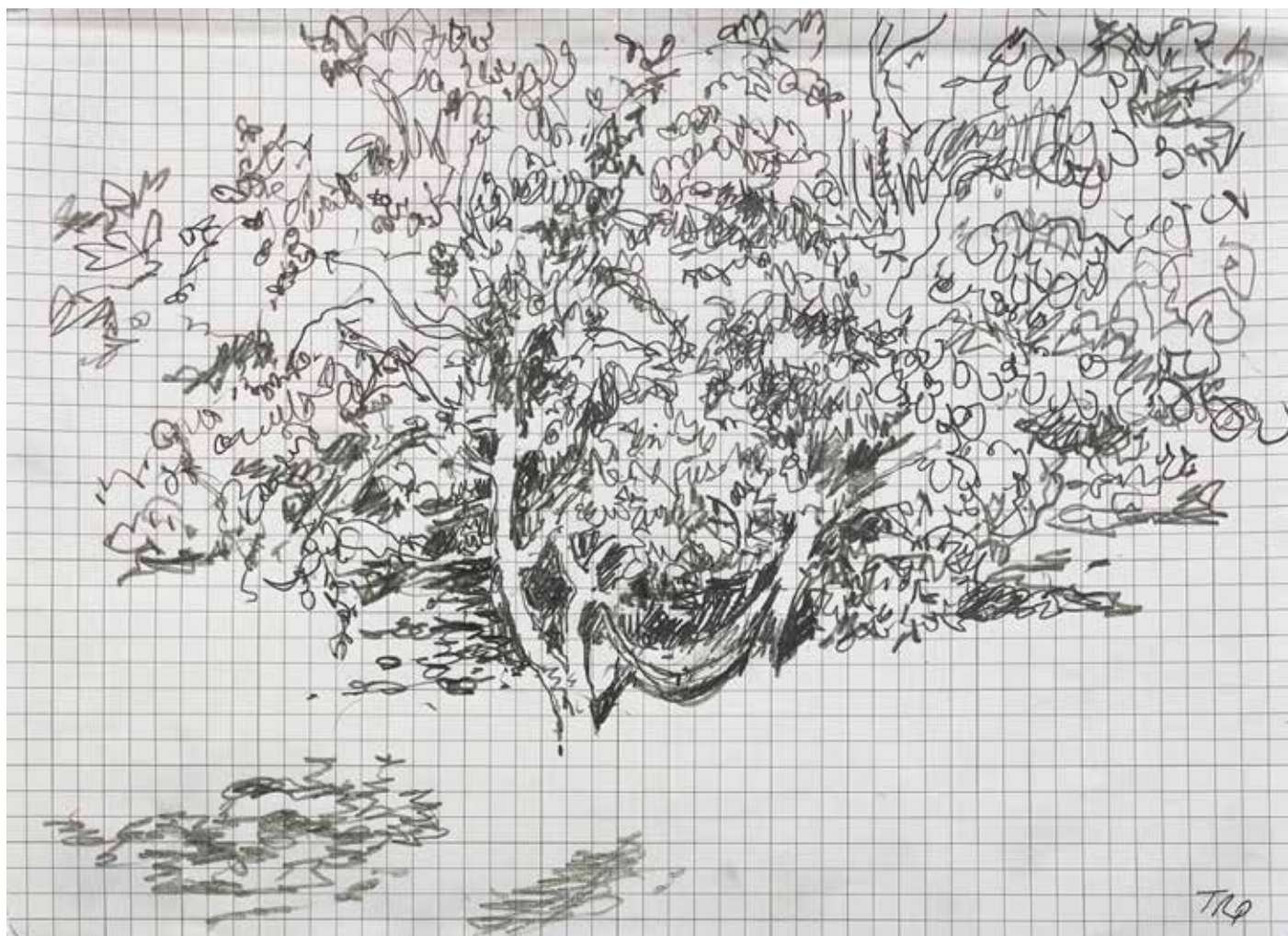
Gérard Traquandi Sans titre (La Garde) , 2020 graphite | 18 x 25 cm 1 950 €