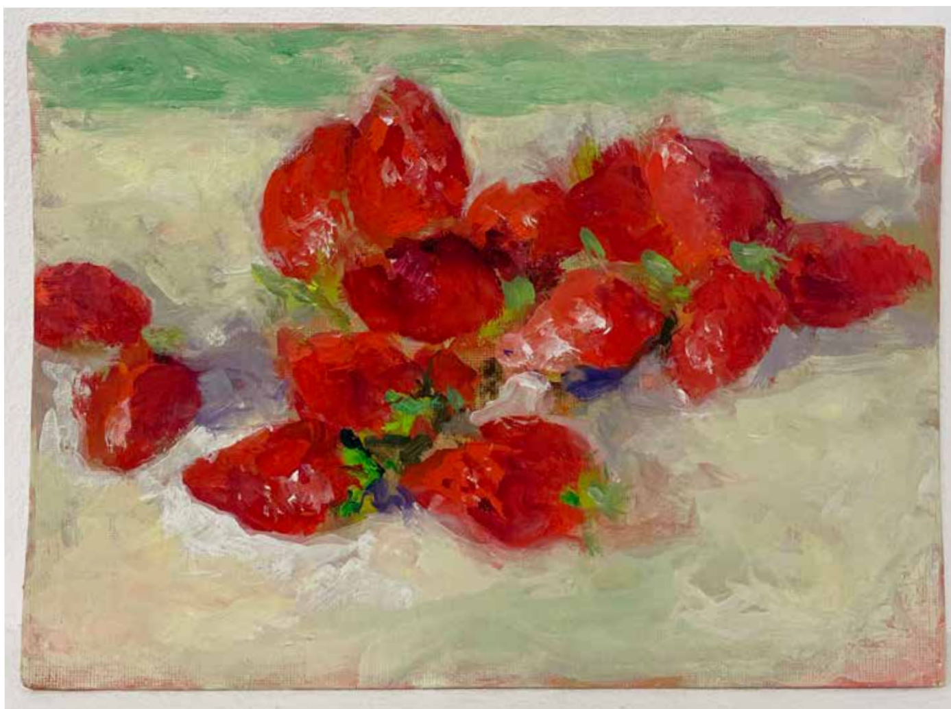
Gérard Traquandi Sans titre (fraises #1) , 2025 huile sur carton entoilé sur châssis | 16 x 23 cm 4 200 €