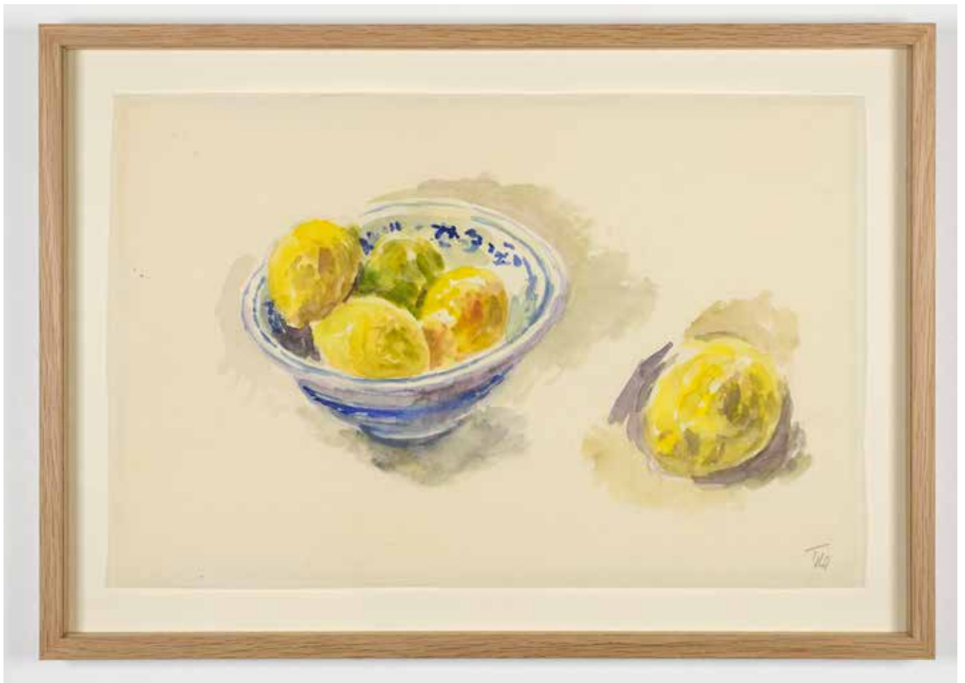
Gérard Traquandi Nature morte aux citrons et compotier , 2020 aquarelle sur papier japon | 23 x 35 cm 3 000 €