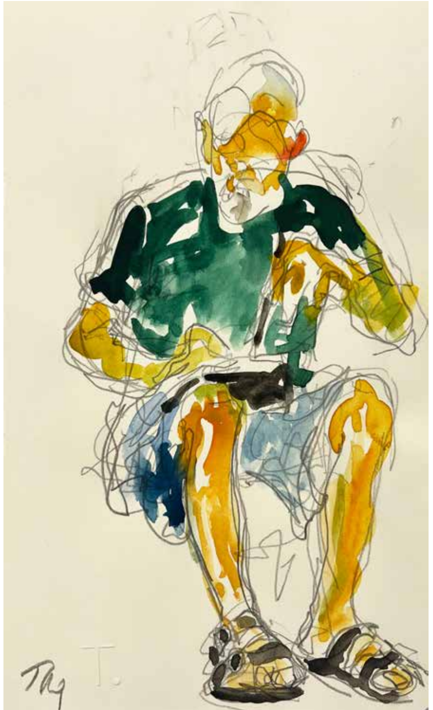
Gérard Traquandi Autoportrait , 2025 aquarelle et graphite sur feuille de carnet | 20,5 x 12,5 cm 1 700 €