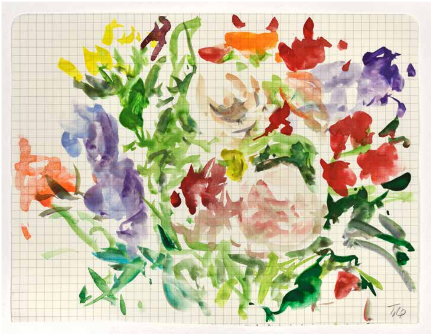
Gérard Traquandi Sans titre , 2021 aquarelle | 19 x 25 cm 2 250 €