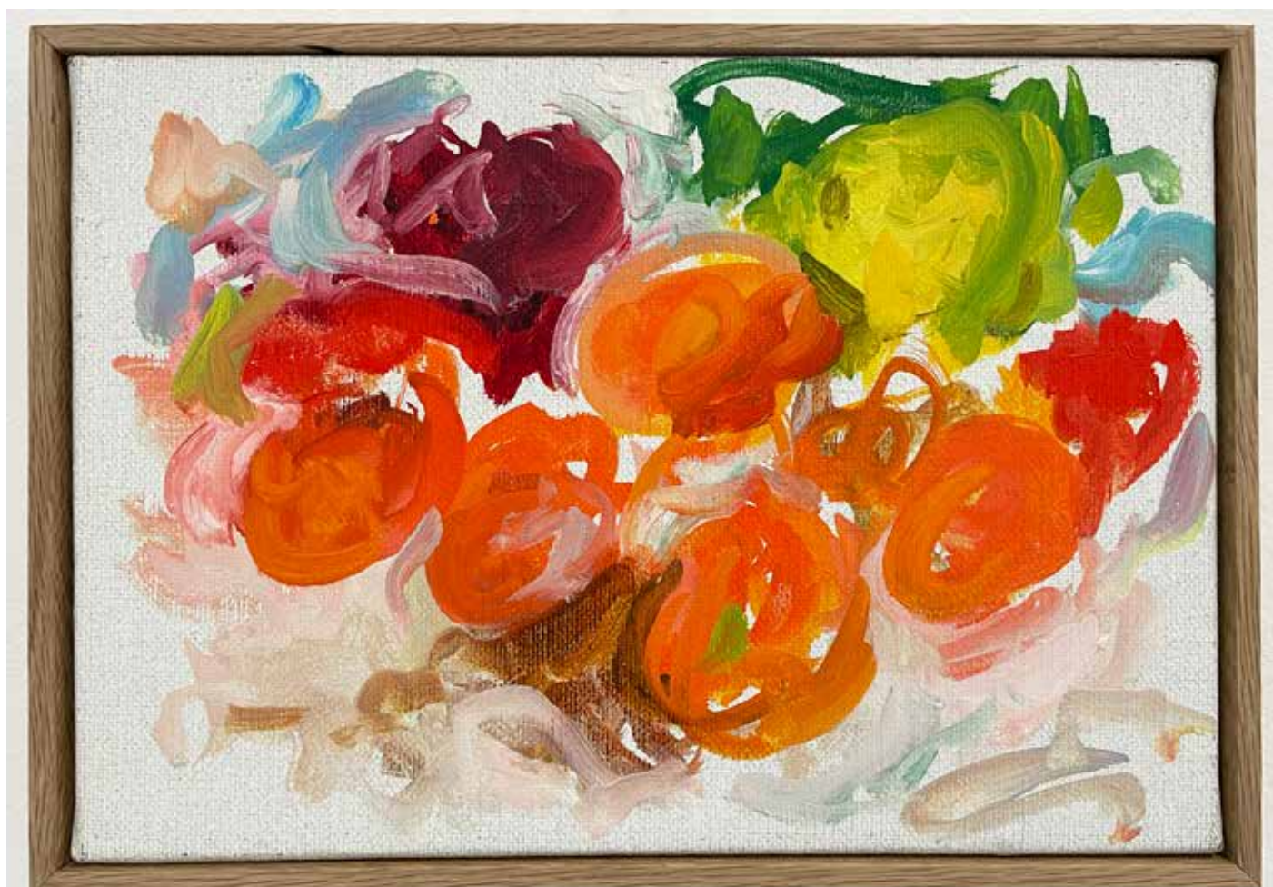
Gérard Traquandi Sans titre (fruits #3) , 2025 huile sur toile | 19 x 27 cm 4 500 €