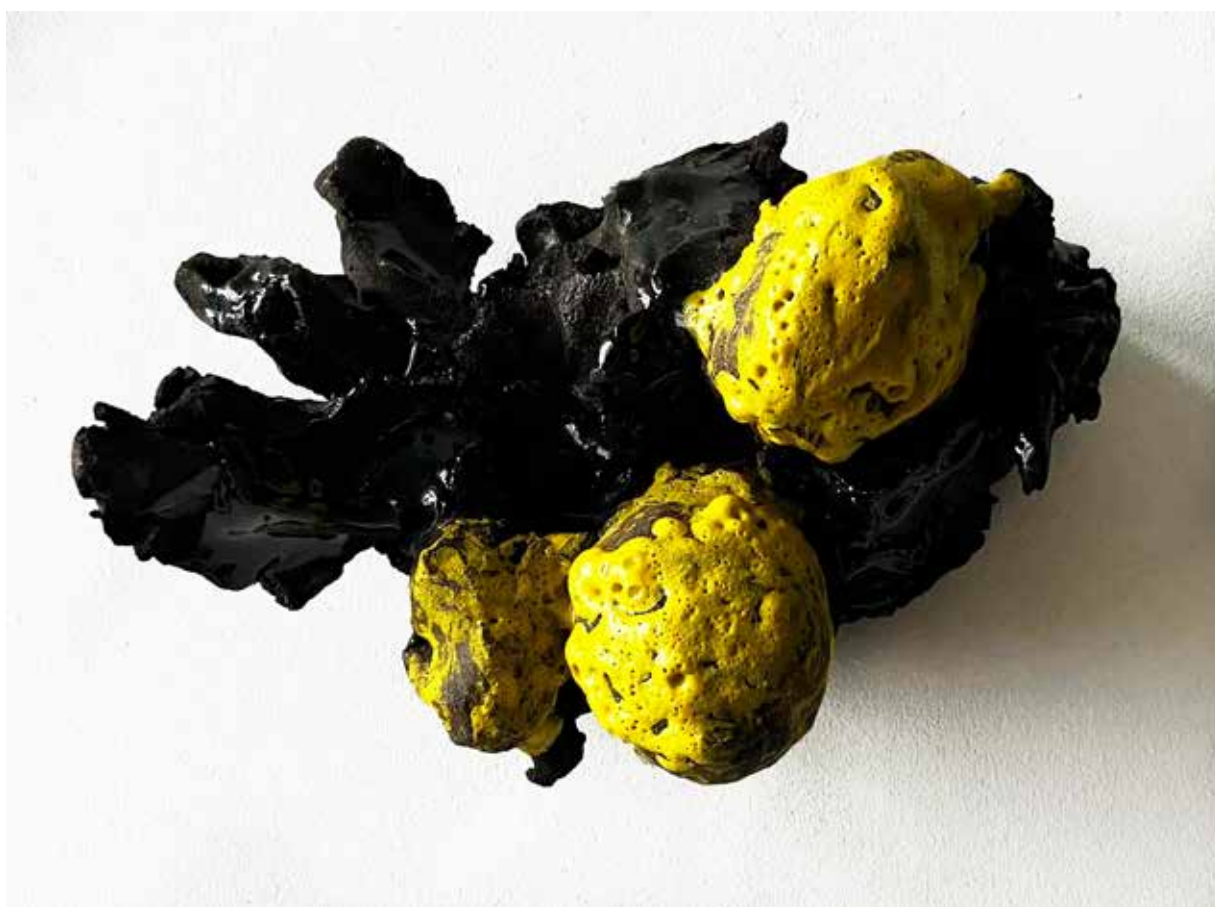
Gérard Traquandi Citrons , 2025 terre cuite émaillée | 18 x 26 cm 7 200 €