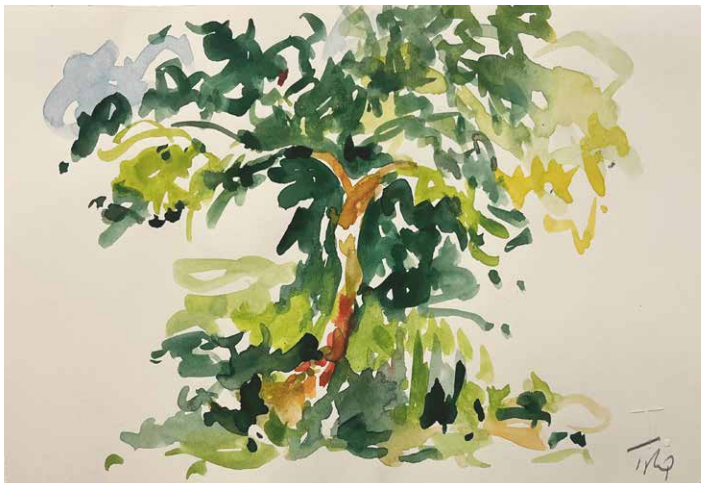
Gérard Traquandi Arbre (Rognes) , 2025 aquarelle et graphite sur feuille de carnet | 12,5 x 20,5 cm 1 700 €