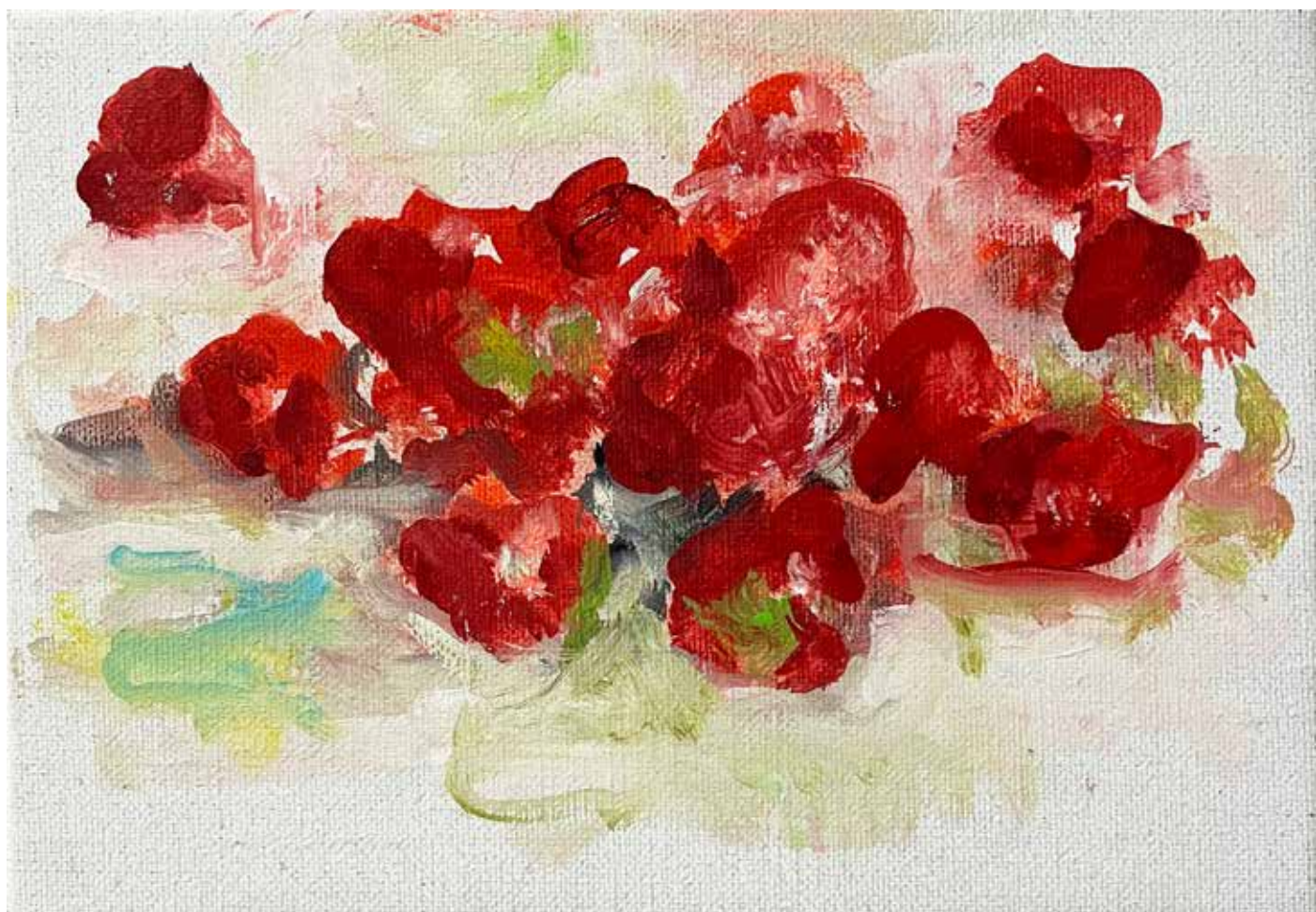
Gérard Traquandi Sans titre (fraises #2) , 2025 huile sur toile | 19 x 27 cm 4 500 €