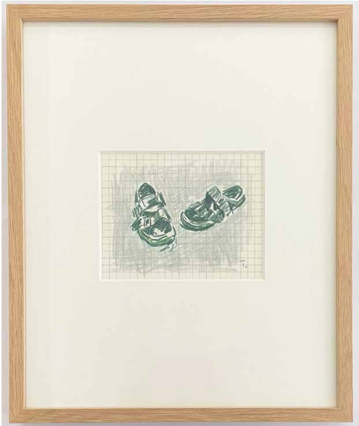
Gérard Traquandi Sans titre (sandales) , 2024 crayon de couleur | 29,4 x 24,2 cm 1 300 €