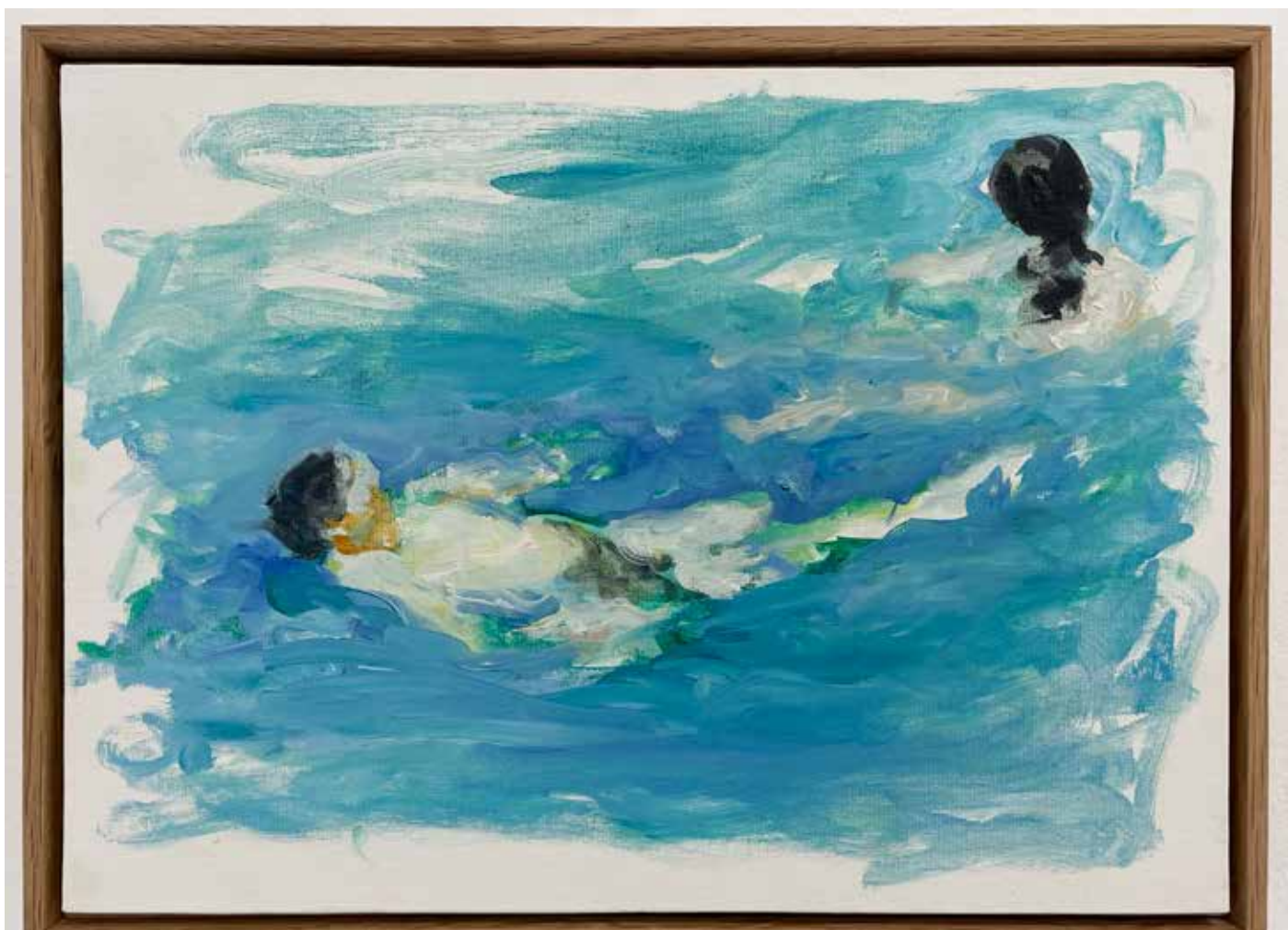
Gérard Traquandi Baigneurs , 2025 huile sur carton entoilé | 24 x 33,5 cm 5 500 €