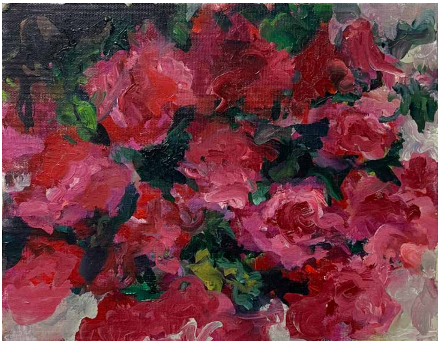
Gérard Traquandi Sans titre (fleurs) , 2025 huile sur carton entoilé monté sur châssis | 19,5 x 24,5 cm 4 400 €