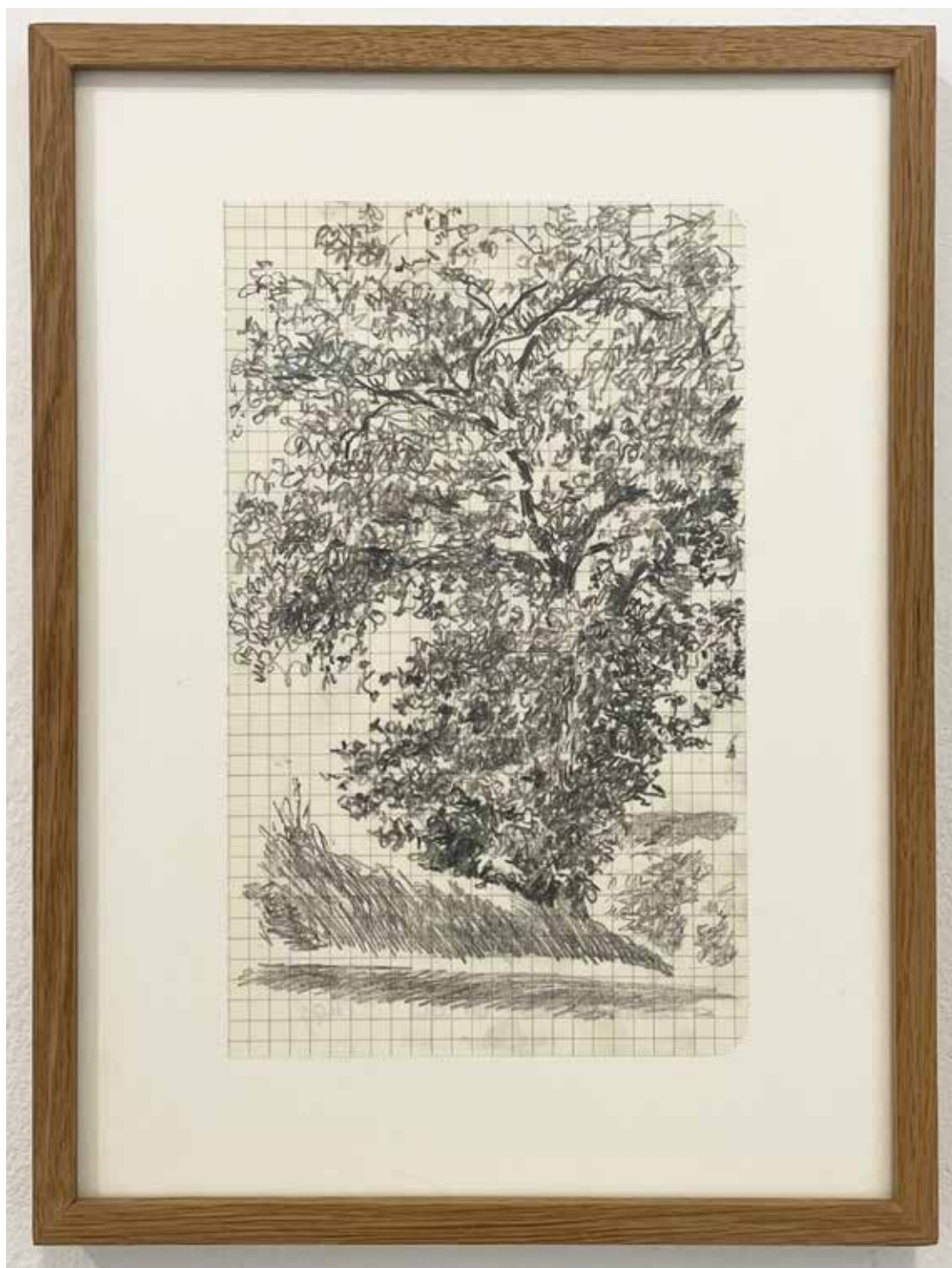
Gérard Traquandi Sans titre #2 , 2025 graphite sur papier quadrillé | 21 x 13 cm 1 500 €