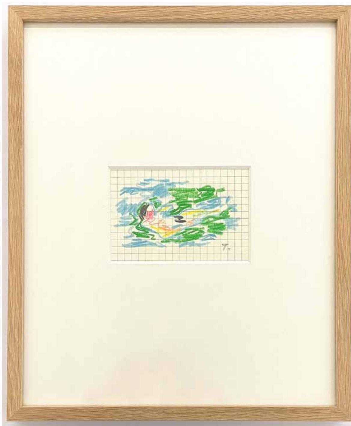
Gérard Traquandi Sans titre (nageur 1) , 2024 crayon de couleur | 29,4 x 24,2 cm 1 300 €