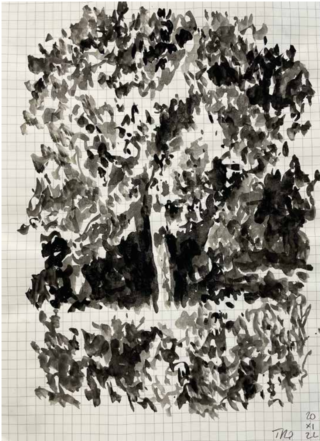
Gérard Traquandi Sans titre (La campagne St Lazare) , 2022 aquarelle | 25 x 18 cm 2 200 €