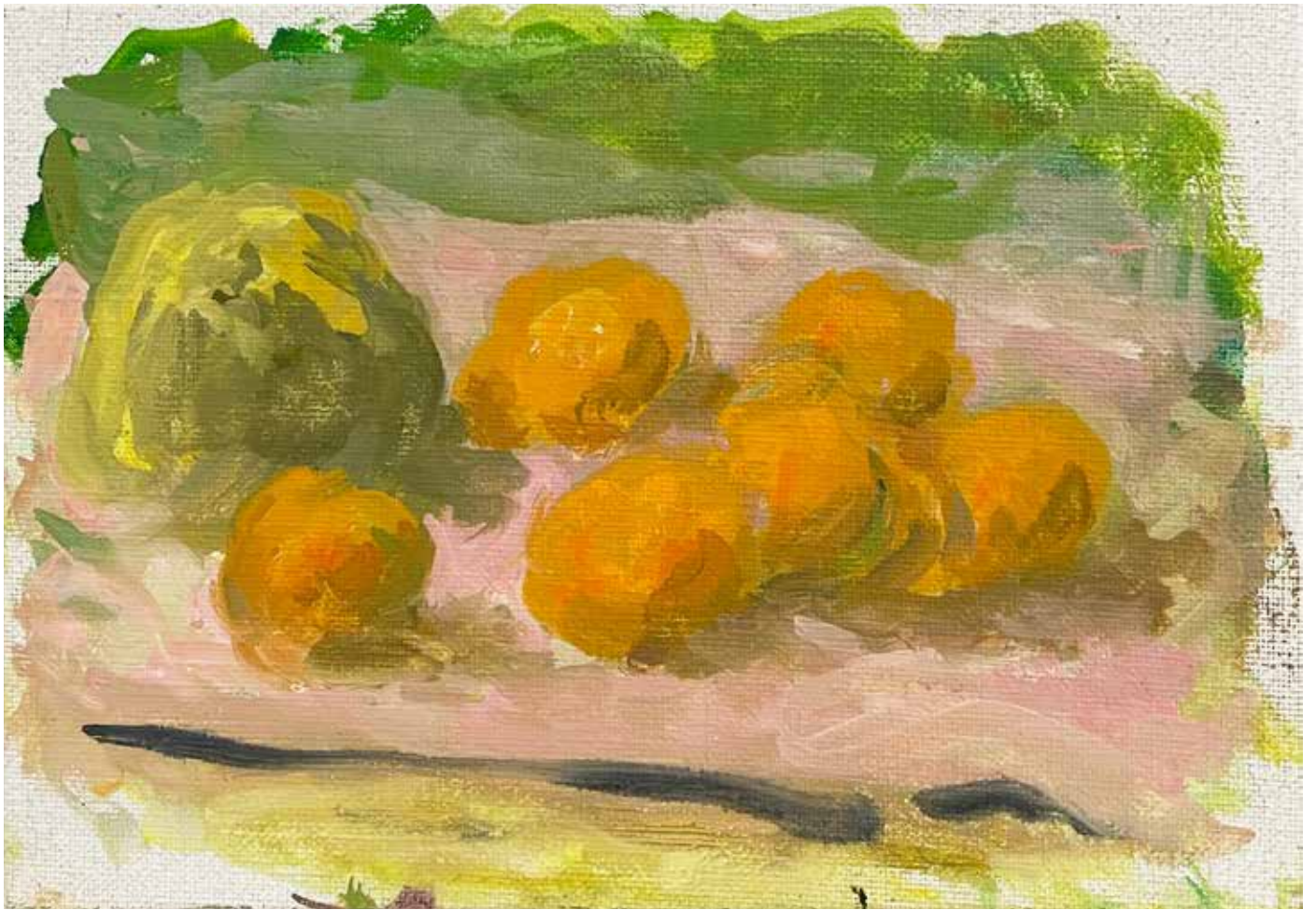
Gérard Traquandi Sans titre (fruits #2) , 2025 huile sur toile | 19 x 27 cm 4 500 €