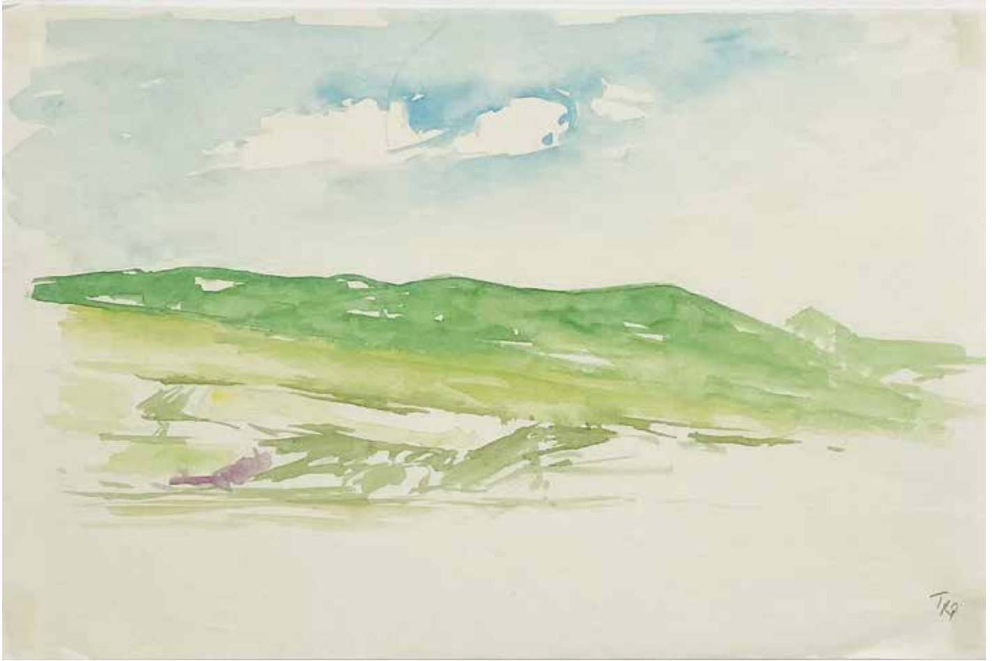
Gérard Traquandi Sans titre , 2023 aquarelle sur papier japon | 23,2 x 35 / 28,5 x 40,5 cm 3 000 €