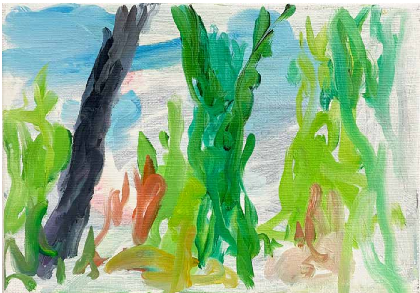
Gérard Traquandi Sans titre (paysage) , 2025 huile sur toile | 19 x 27 cm 4 500 €