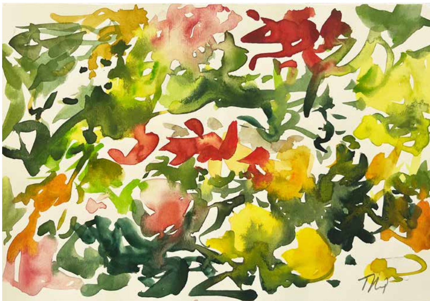
Gérard Traquandi Sans titre (fleurs) , 2025 aquarelle sur feuille de carnet | 12,5 x 20,5 cm 1 700 €