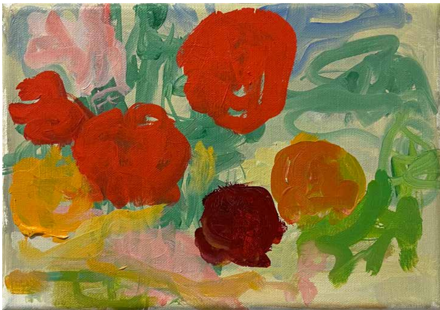
Gérard Traquandi Sans titre (fruits #4) , 2025 huile sur toile | 19 x 27 cm 4 500 €