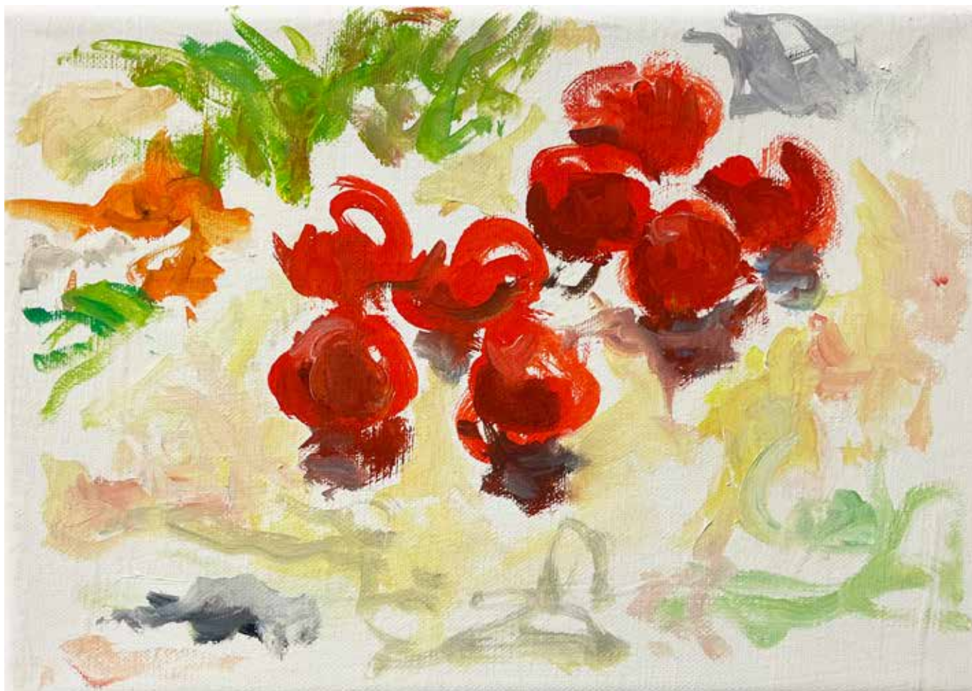
Gérard Traquandi Sans titre (tomates #1) , 2025 huile sur toile | 19 x 27 cm 4 500 €