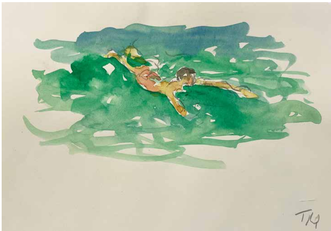
Gérard Traquandi Baigneur , 2025 aquarelle et graphite sur feuille de carnet | 12,5 x 20,5 cm 1 700 €