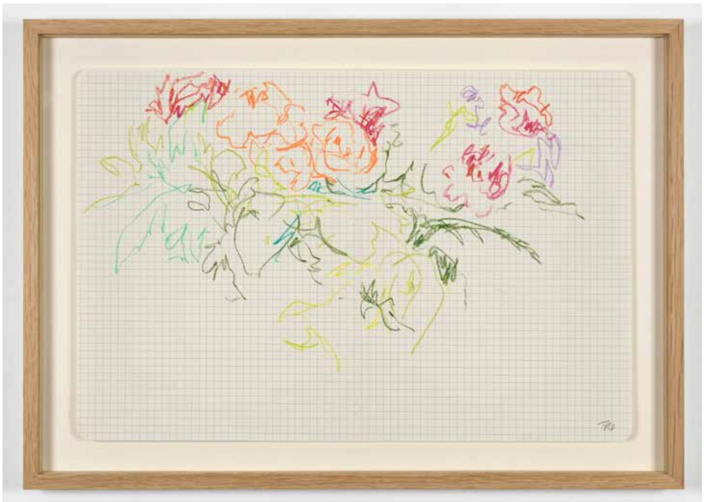
Gérard Traquandi Sans titre , 2022 crayon de couleur | 25 x 37,5 cm 2 750 €