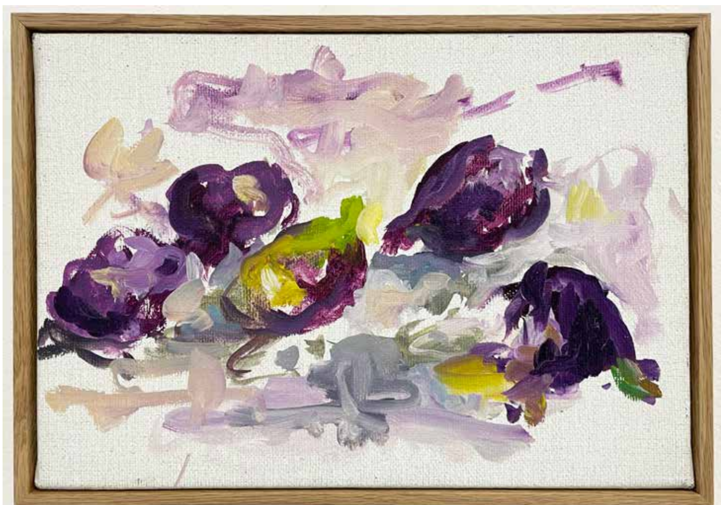
Gérard Traquandi Sans titre (figues) , 2025 huile sur toile | 19 x 27 cm 4 500 €