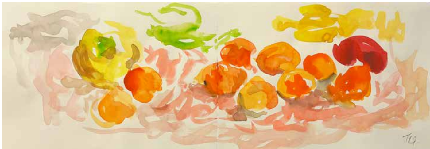
Gérard Traquandi Sans titre (fruits #4) , 2025 aquarelle sur feuille de carnet | 14 x 41 cm 2 800 €