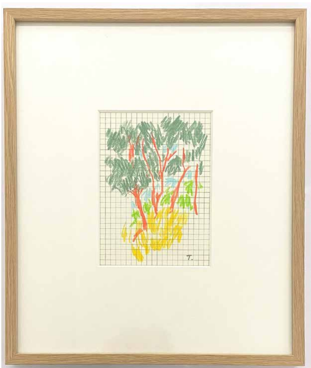
Gérard Traquandi Sans titre (paysage 3) , 2024 crayon de couleur | 33,5 x 28,3 cm 1 500 €