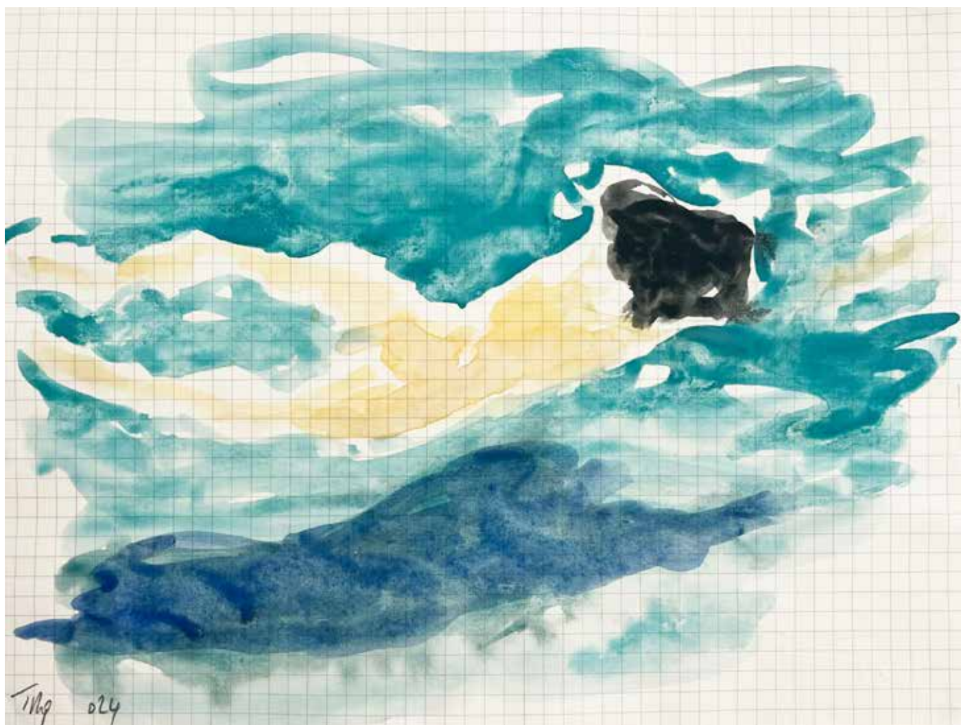
Gérard Traquandi Nageuse #2 , 2025 aquarelle sur papier quadrillé | 19 x 25 cm 2 250 €