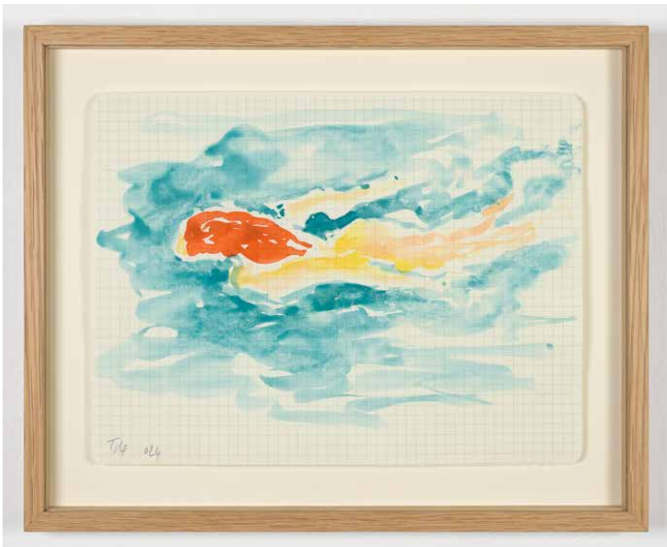
Gérard Traquandi Nageuse #1 , 2025 aquarelle sur papier quadrillé | 19 x 25 cm 2 250 €