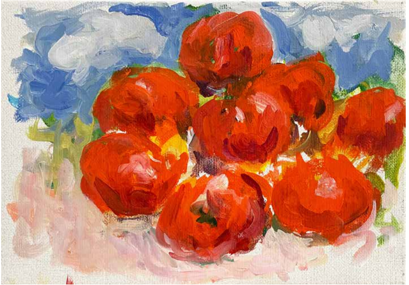
Gérard Traquandi Sans titre (tomates #2) , 2025 huile sur toile | 19 x 27 cm 4 500 €