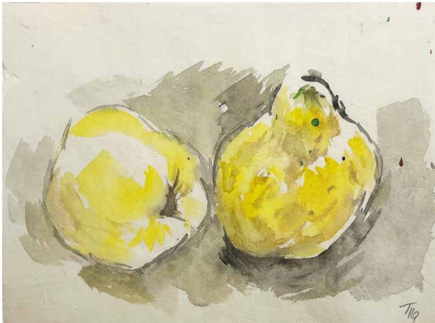
Gérard Traquandi Les Coings , 2020 aquarelle sur papier japon | 23 x 17,5 cm 2 100 €