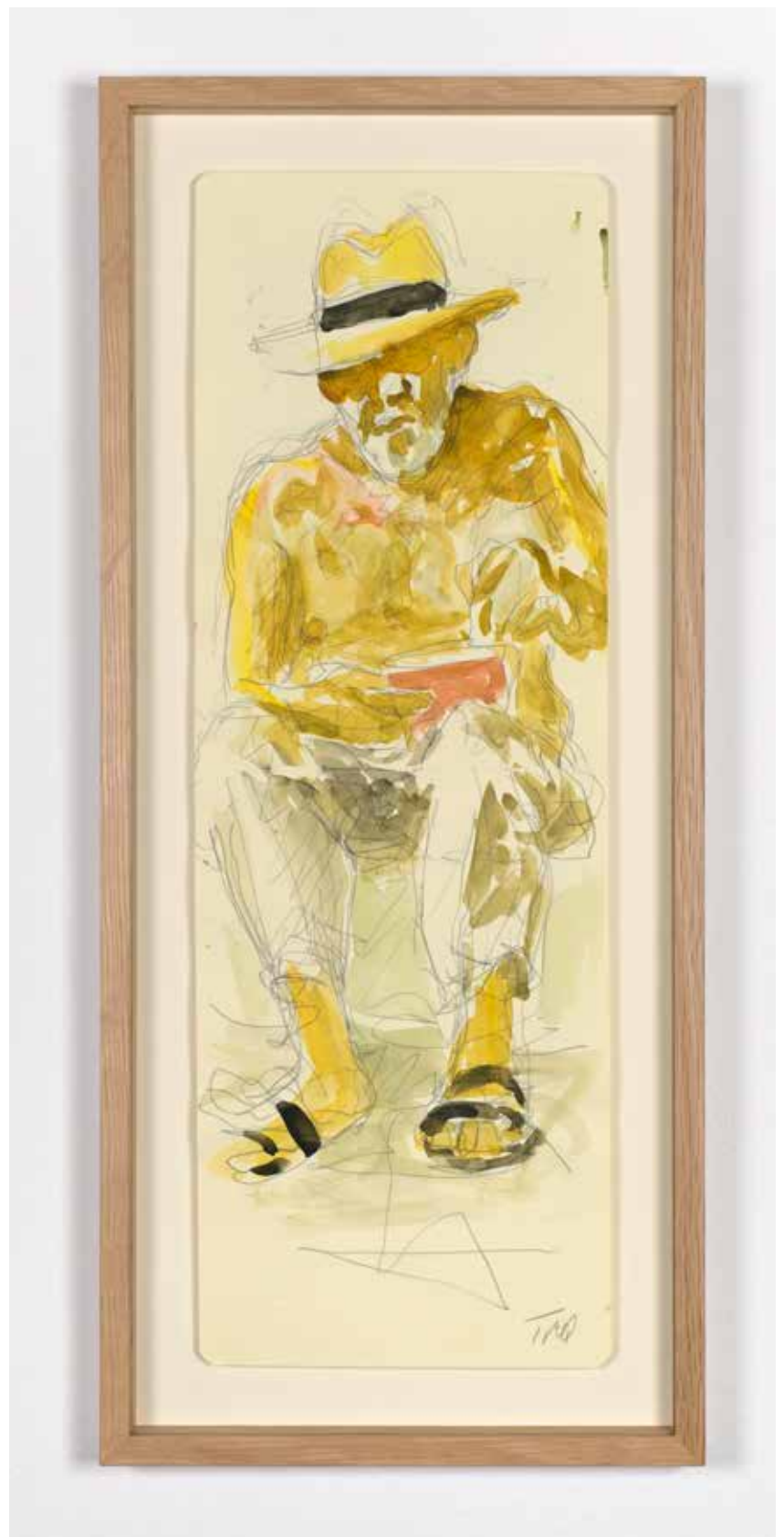
Gérard Traquandi Autoportrait , 2025 aquarelle et graphite sur feuille de carnet | 41 x 14 cm 2 800 €