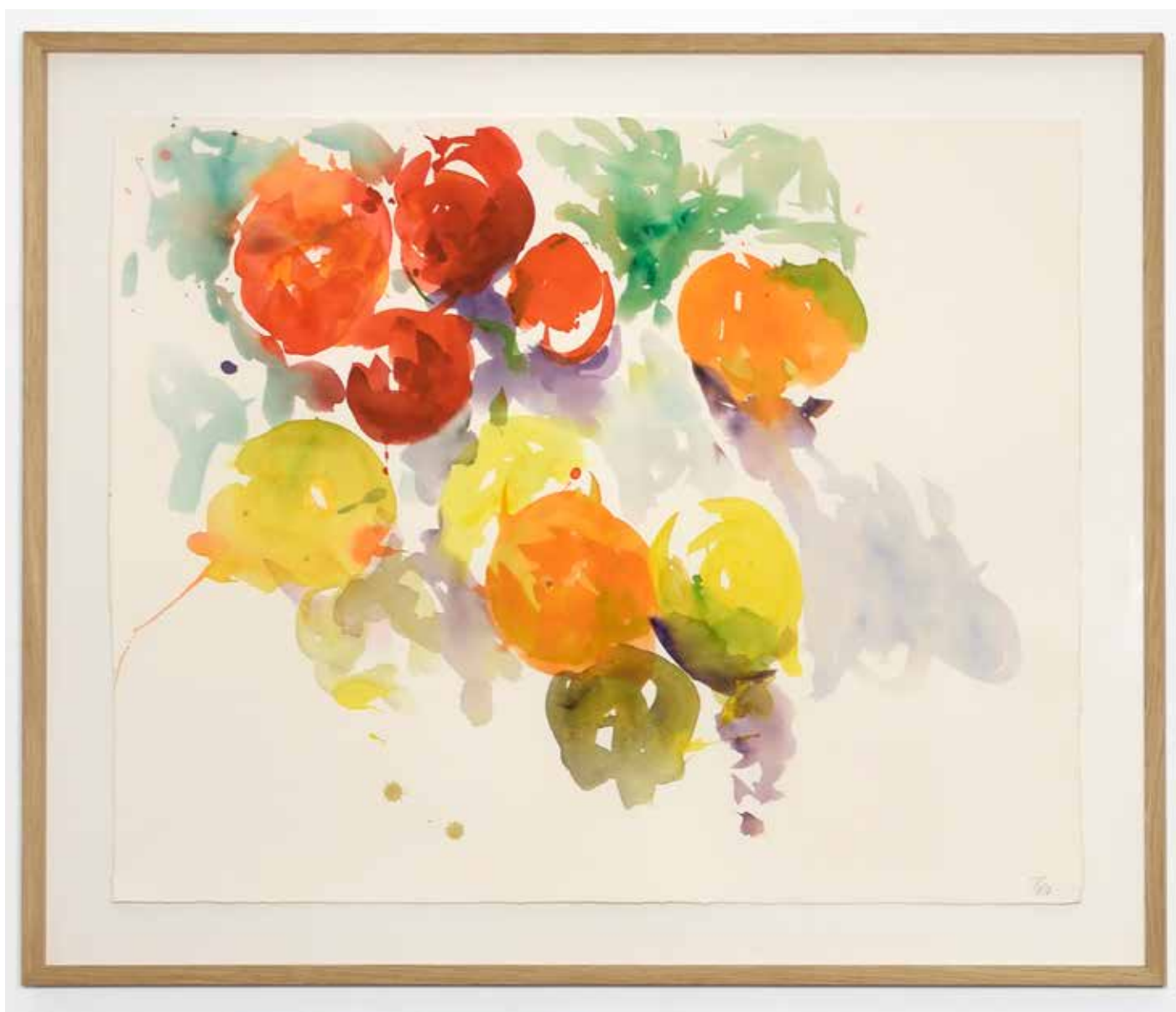
Gérard Traquandi Sans titre , 2023 aquarelle | 62 x 76 / 75,5 x 90 cm 7 000 €