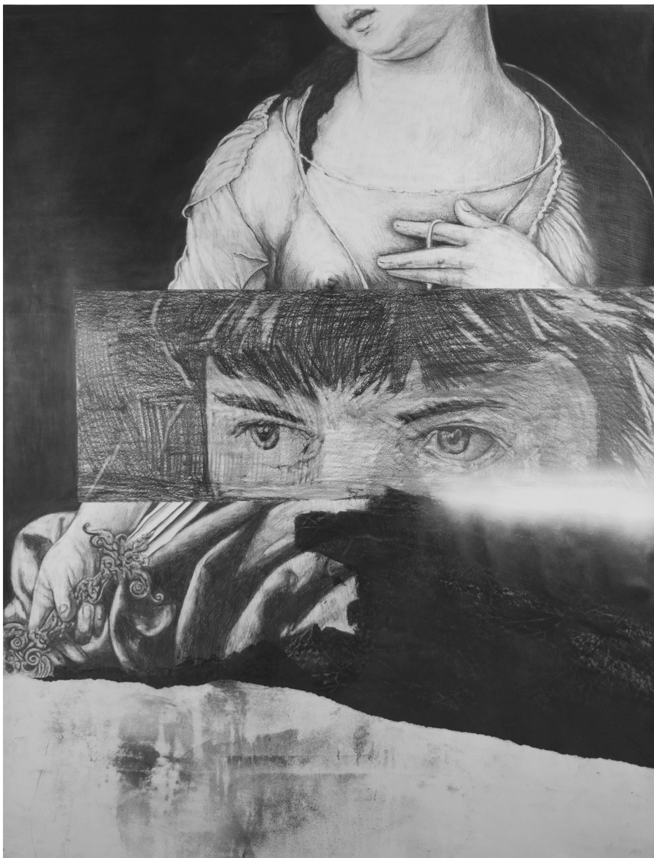
Frédéric Malette Que les loups vivent le vent #5 , 2019 | graphite, encre et collage sur papier | 155 x 120 cm