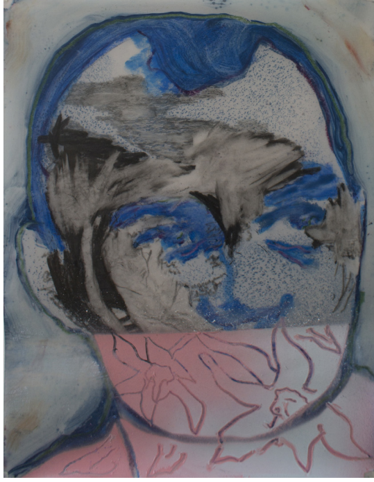
Frédéric Malette Bouche de fleur , 2023 | graphite, pastel et essence sur calque | 32 x 24 cm (chaque)