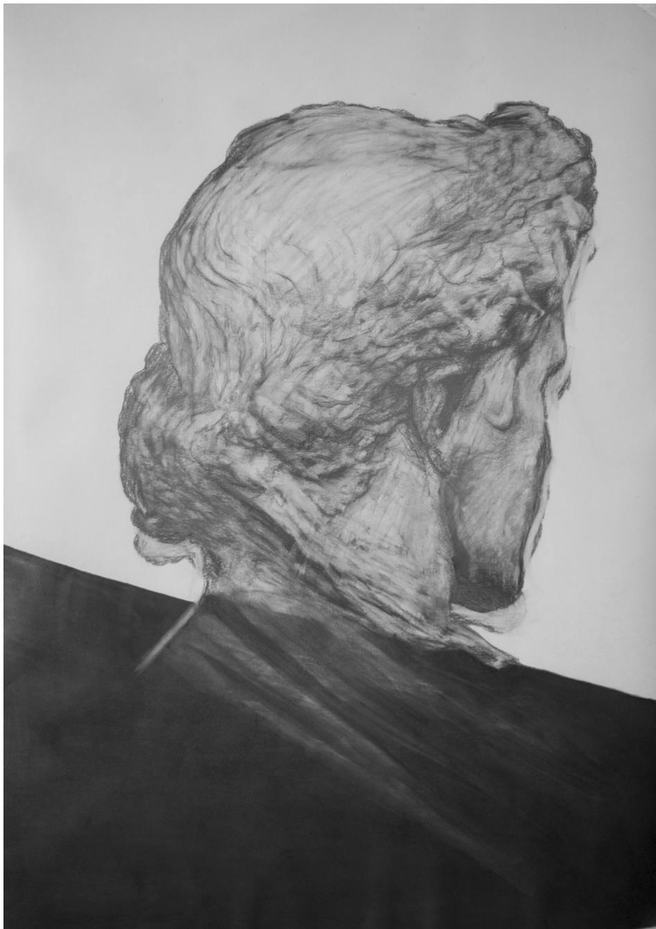
Frédéric Malette Marquée au front un serpent dans le coeur , 2018 | graphite sur calque | 100 x 70 cm