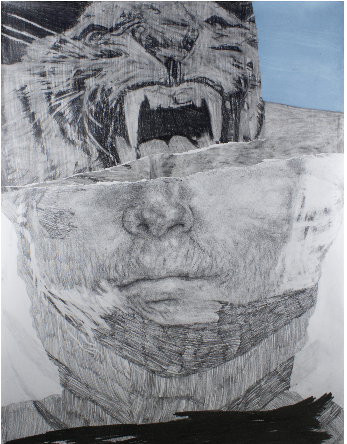
Frédéric Malette Que les loups vivent le vent #4 , 2019 | graphite, encre et collage sur papier | 155 x 120 cm