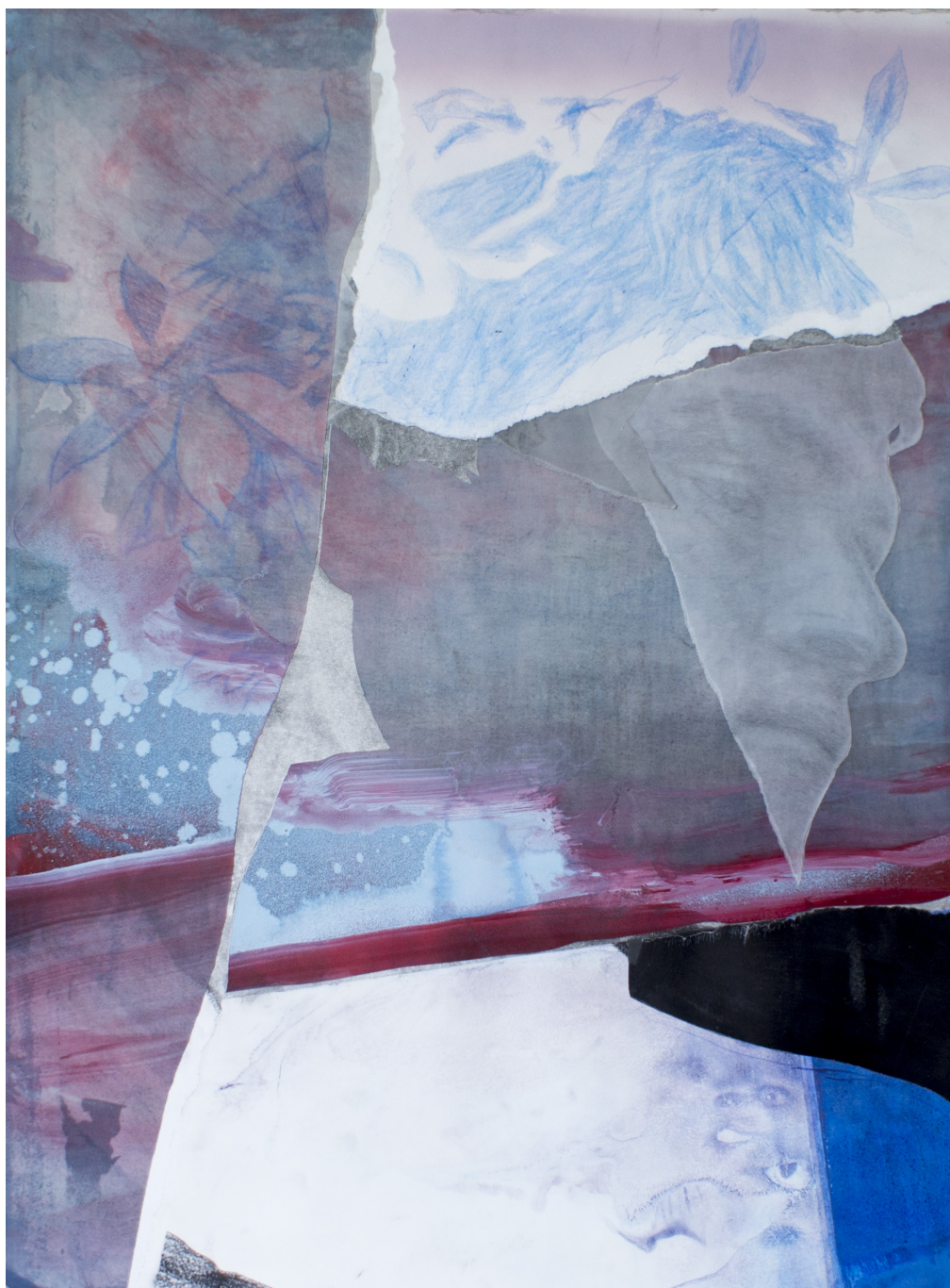
Frédéric Malette Le morceau de ciel bleu dans l'éclair #4 , 2020 | graphite, essence, acrylique, collage sur calque et papier | 80 x 60 cm