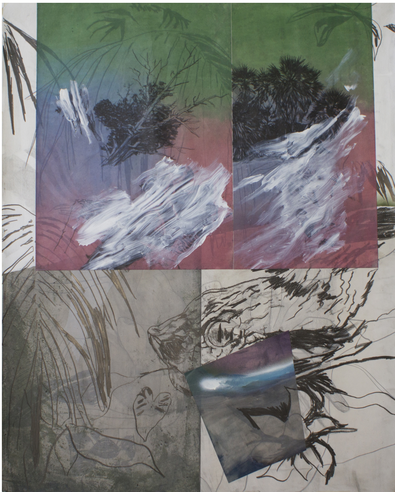
Frédéric Malette Serpent , 2022 | graphite, pastel, essence et collage sur calque et papier | 150 x 120