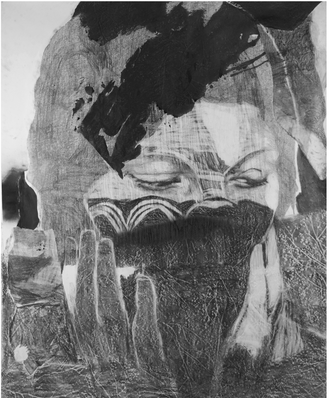
Frédéric Malette Les oiseaux vont dévorer la chair des princes , 2019 | graphite, encre et collage sur papier | 177 x 145 cm