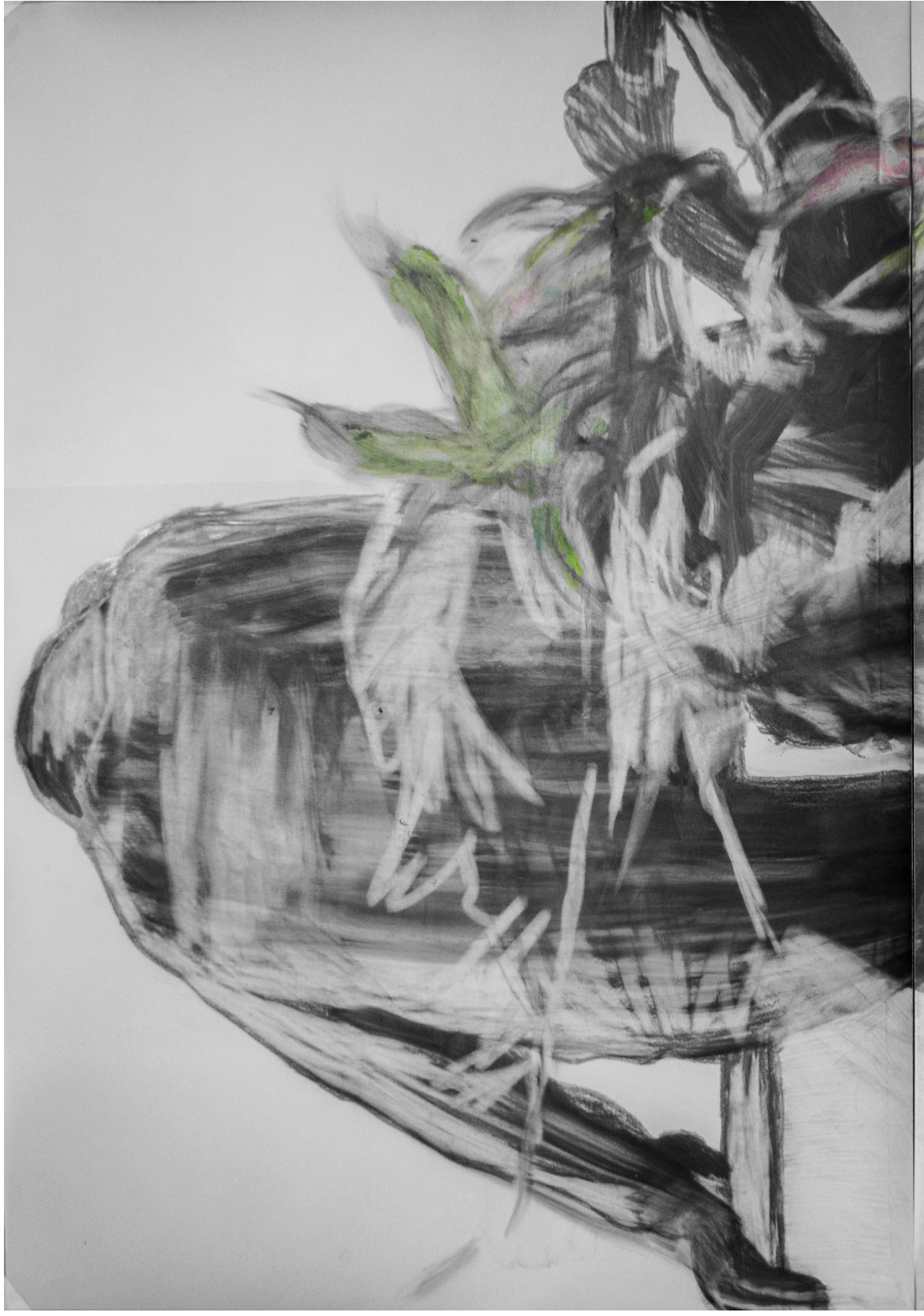
Frédéric Malette Faites courir un poème sans fin , 2018 | graphite et acrylique sur calque | 1100 x 70 (x2 - diptyque)