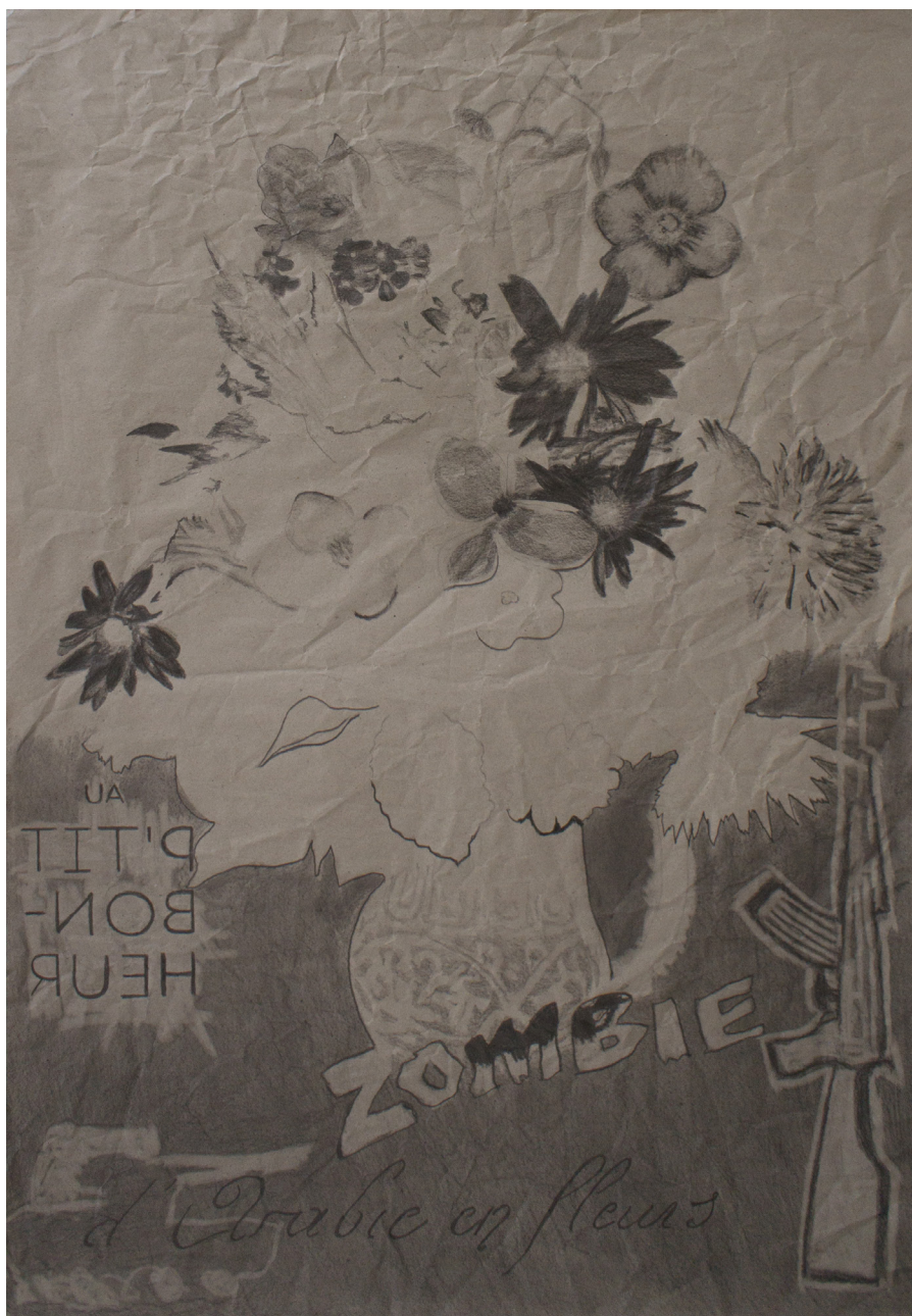
Frédéric Malette Zombie d'Arabie en fleurs , 2022 | graphite sur kraft | 100 x 70 cm