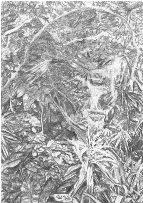
Frédéric Malette Menaçant d'exploser au-delà des étoiles , 2020 | graphite | 29,7 x 21 cm (chaque)