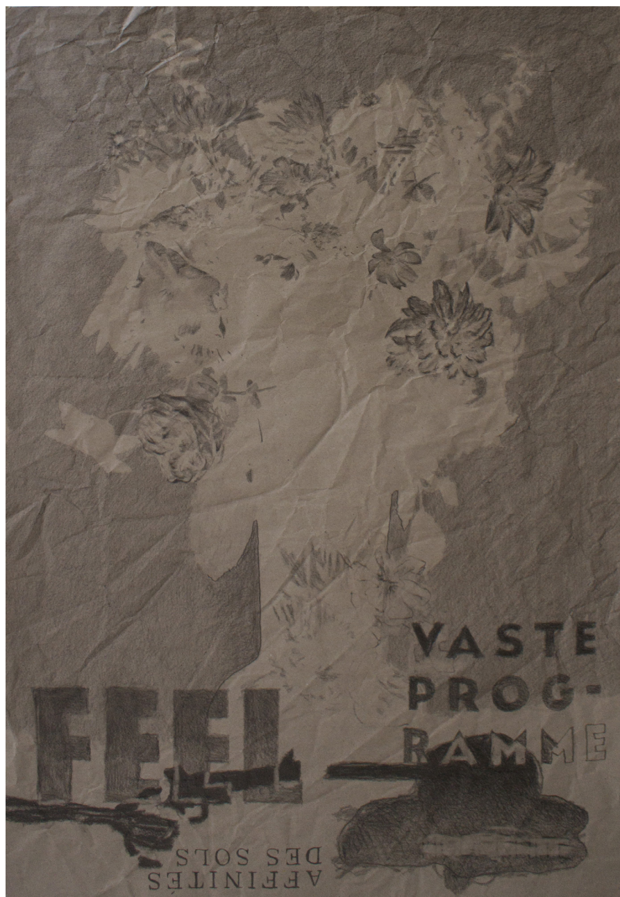
Frédéric Malette Vaste programme , 2022 | graphite sur kraft | 100 x 70 cm