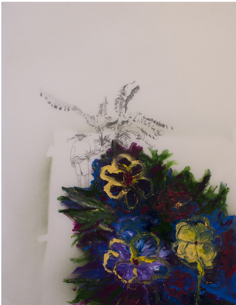
Frédéric Malette Croûte #1 , 2022 | graphite et acrylique sur calque | 65 x 50 cm