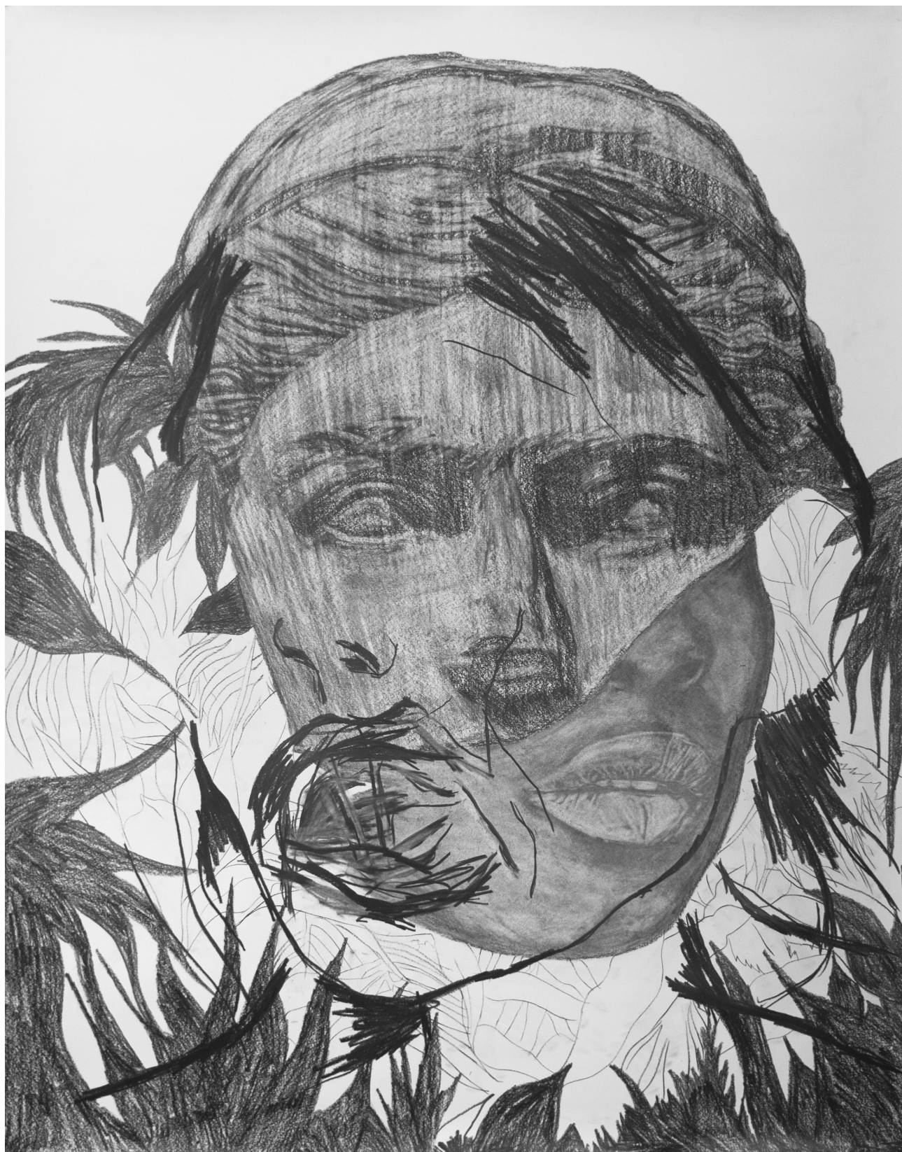
Frédéric Malette Les méditerranéens , 2021 | graphite, acrylique et colle | 151 x 118 cm