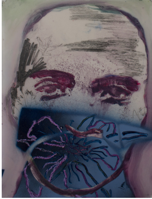
Frédéric Malette Bouche de fleur , 2023 | graphite, pastel et essence sur calque | 32 x 24 cm (chaque)