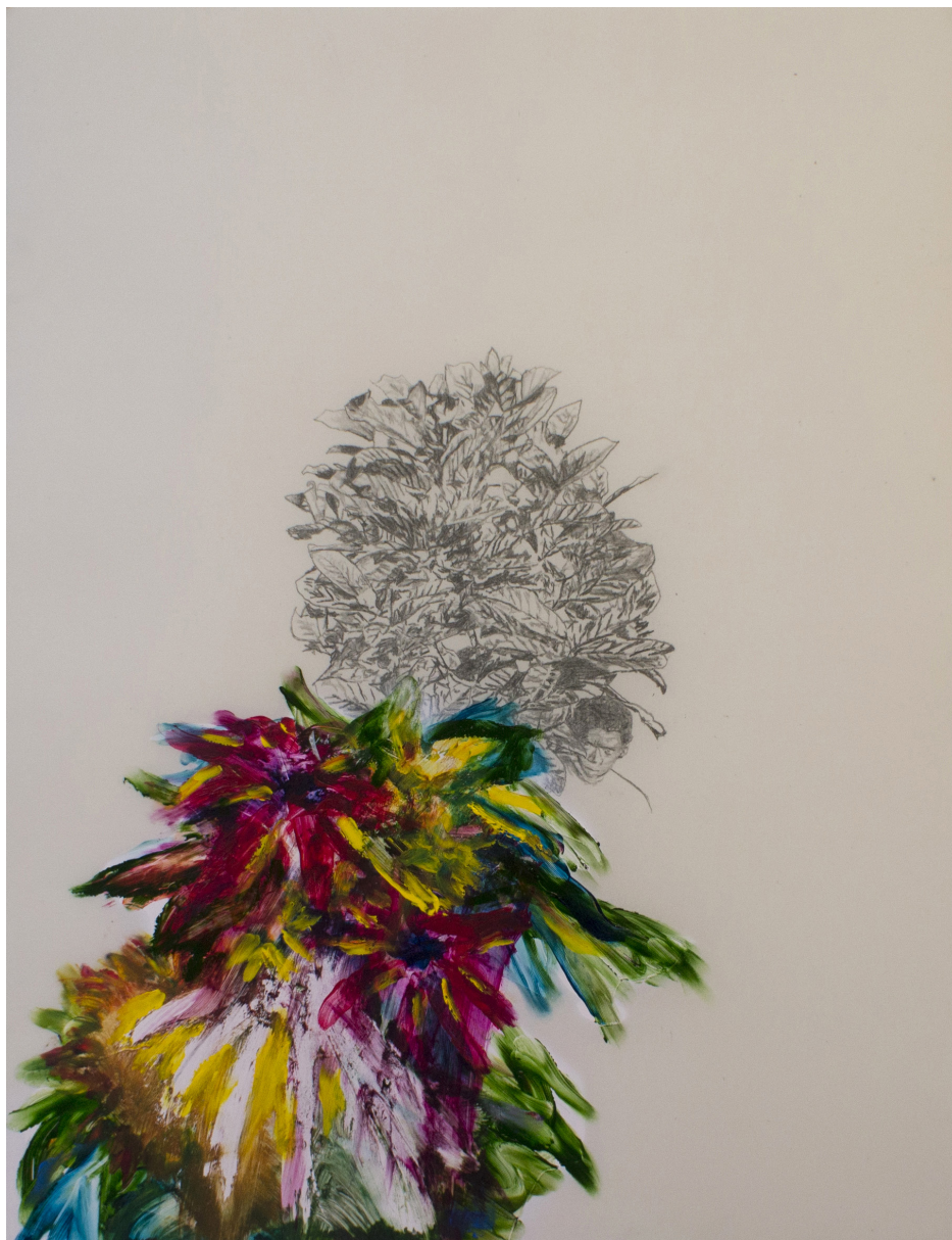
Frédéric Malette Croûte #3 , 2022 | graphite et acrylique sur calque | 65 x 50 cm