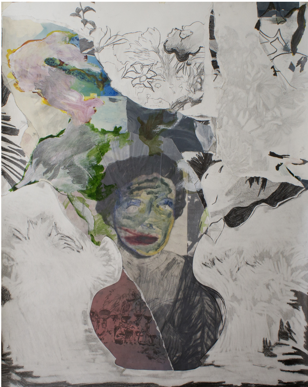
Frédéric Malette Vase , 2022 | graphite, pastel, colle et essence sur calque et papier | 150 x 120 cm