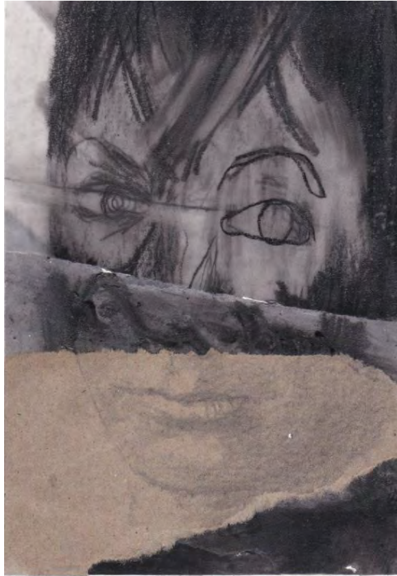
Frédéric Malette "Les méditerranéens" #1, 2021 graphite, acrylique, colle 15 x 10,5 cm