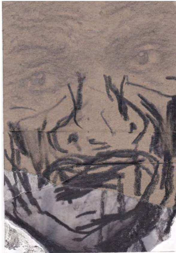
Frédéric Malette "Les méditerranéens" #6, 2021 graphite, acrylique, colle 15 x 10,5 cm