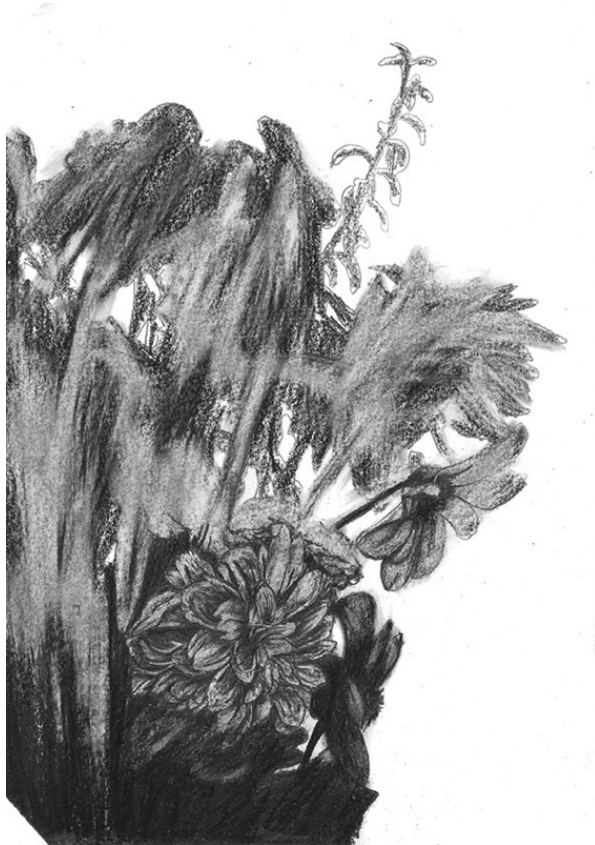
Frédéric Malette "Prémices de sublime inutilité" #2, 2016 graphite 29,7 x 21 cm