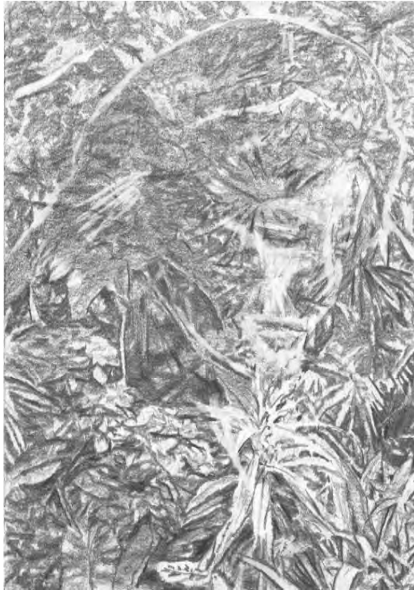
Frédéric Malette "Menaçant d'exploser au-delà des étoiles" #2, 2020 graphite 29,7 x 21 cm cm