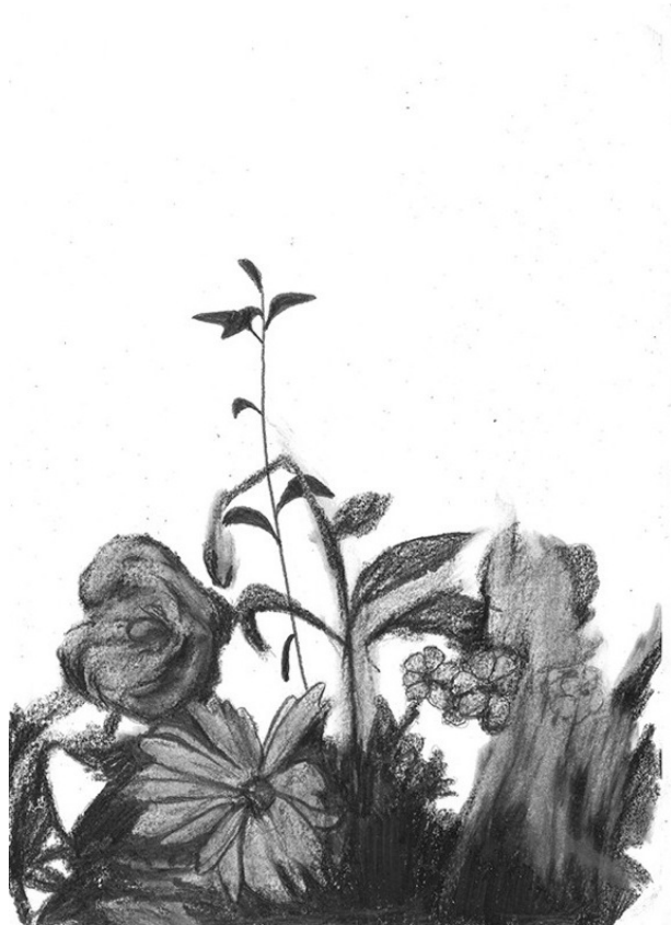
Frédéric Malette “Prémices de sublime inutilité” #9, 2016 graphite 29,7 x 21 cm