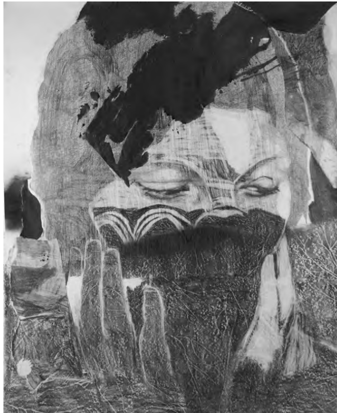
Frédéric Malette "Les oiseaux vont dévorer la chair des princes", 2019 graphite, encre, et colle sur papier 177 x 145 cm