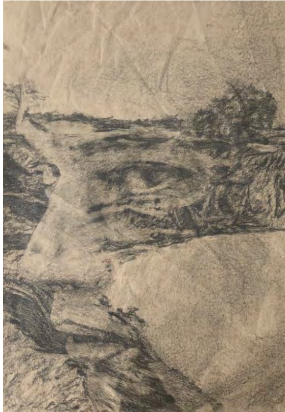
Frédéric Malette "sans titre", 2021 graphite 50 x 35 cm