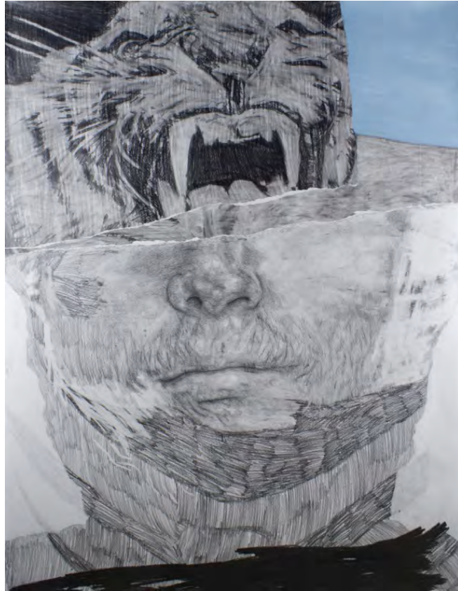
Frédéric Malette "Que les loups vivent le vent" #4, 2019 graphite, encre et colle sur papier 155 x 120 cm