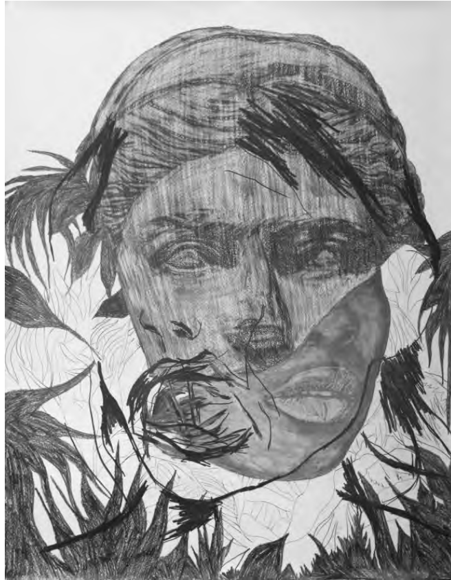
Frédéric Malette "Les méditerranéens", 2021 graphite, acrylique, colle 151 x 118 cm