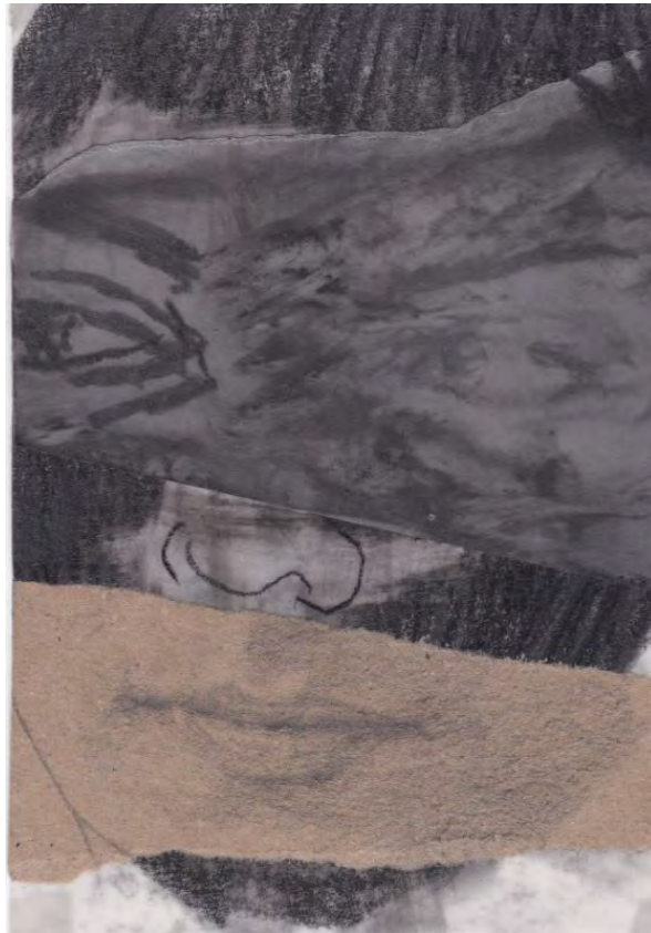
Frédéric Malette "Les méditerranéens" #4, 2021 graphite, acrylique, colle 15 x 10,5 cm