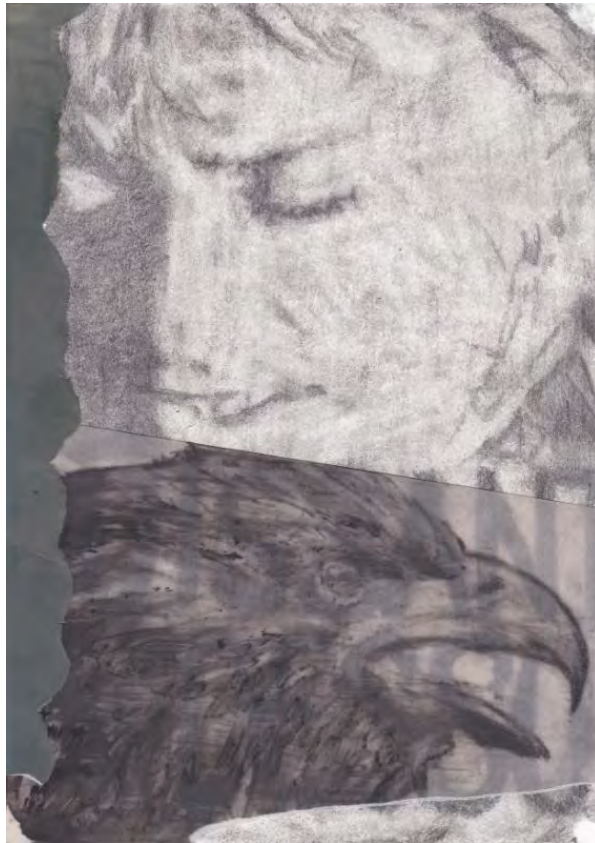
Frédéric Malette "Imaginer être l'oiseau", 2020 graphite, essence, encre, colle sur papier et calque de chaire et calque 29,7 x 21 cm