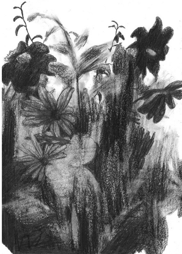
Frédéric Malette “Prémices de sublime inutilité” #1, 2016 graphite 29,7 x 21 cm