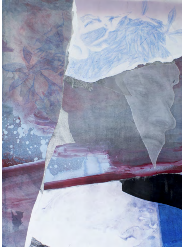
Frédéric Malette "Le morceau de ciel bleu dans l'éclair" #2, 2020 graphite, essence, acrylique, colle sur calque et papier 80 x 60 cm