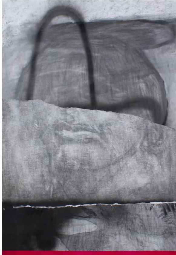
Frédéric Malette "Une tentative de poésie", 2019 graphite, colle et acrylique (avec cadre) 100 x 70 cm