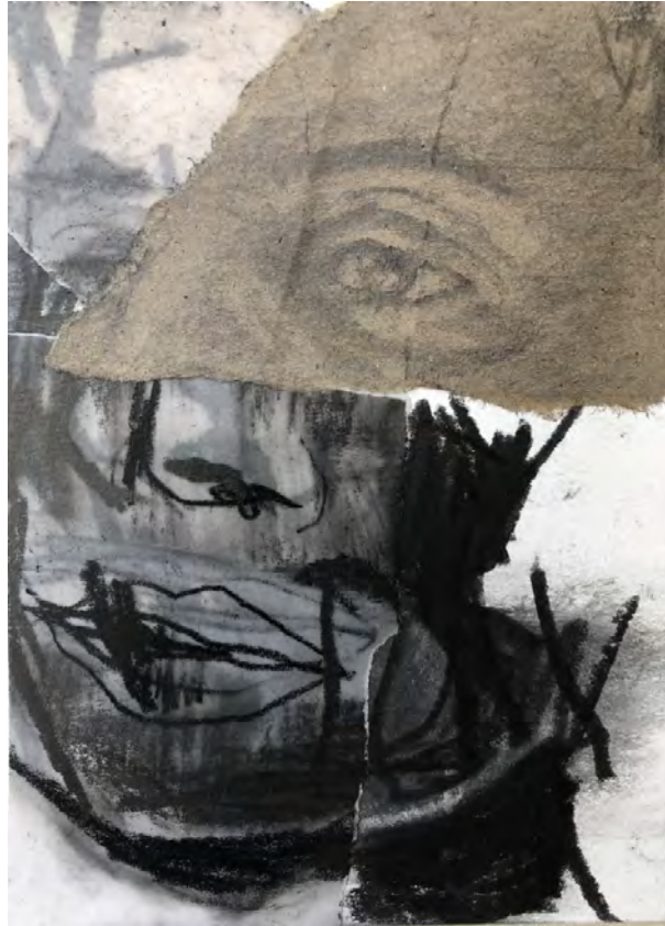
Frédéric Malette "Les méditerranéens" #7, 2021 graphite, acrylique, colle 15 x 10,5 cm