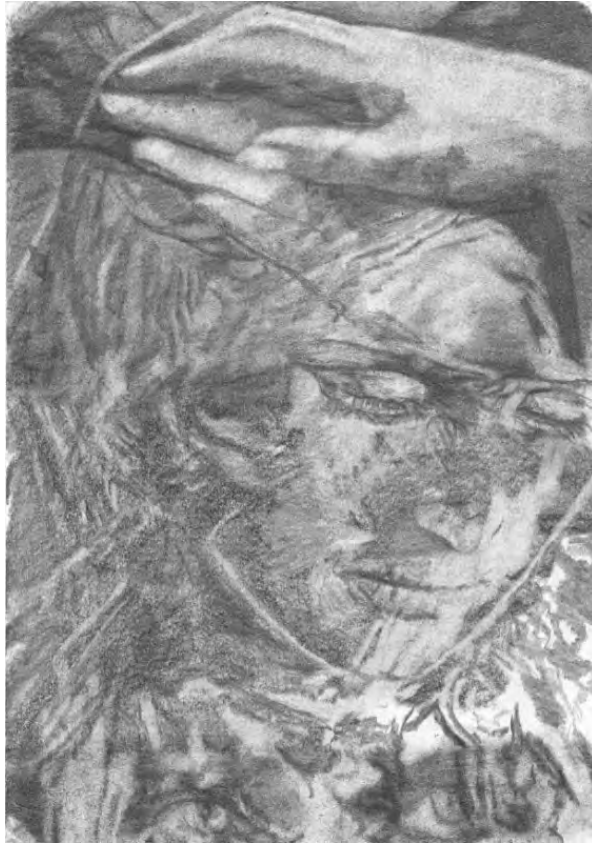
Frédéric Malette "Menaçant d'exploser au-delà des étoiles" #1, 2020 graphite 29,7 x 21 cm cm