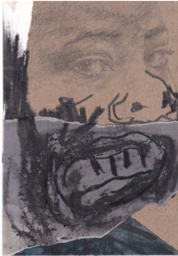
Frédéric Malette "Les méditerranéens" #5, 2021 graphite, acrylique, colle 15 x 10,5 cm