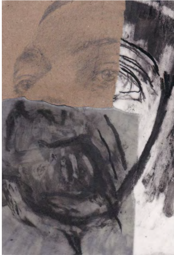
Frédéric Malette "Les méditerranéens" #2, 2021 graphite, acrylique, colle 15 x 10,5 cm