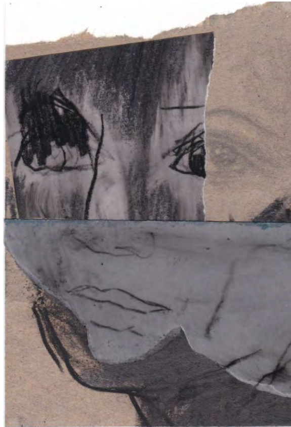
Frédéric Malette "Les méditerranéens" #3, 2021 graphite, acrylique, colle 15 x 10,5 cm