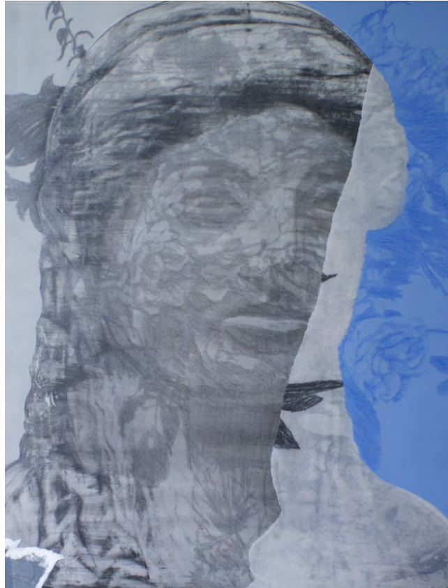
Frédéric Malette "Le morceau de ciel bleu dans l'éclair" #1, 2020 graphite sur calque, essence, colle, papier 65 x 50 cm