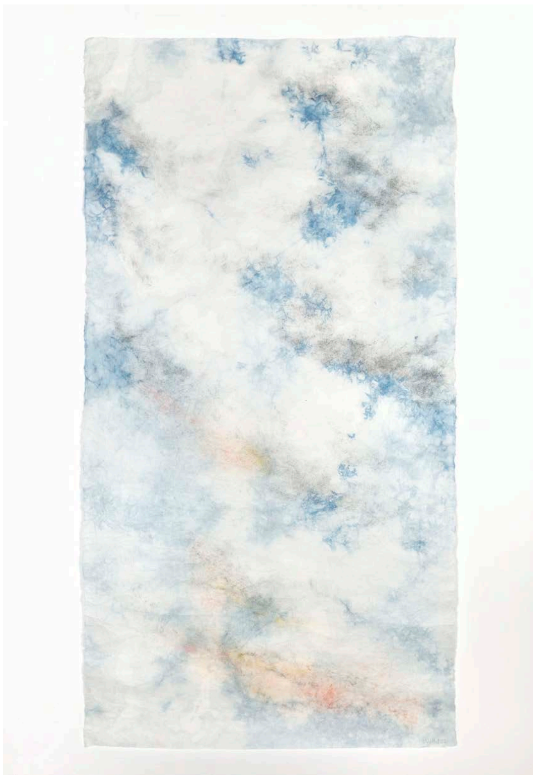
Eloïse Van der Heyden Ciel intérieur #2 , 2022 teinture à l'indigo, pastel, graphite et peinture aérosol sur papier coréen | 120 x 70 cm 3 500 €