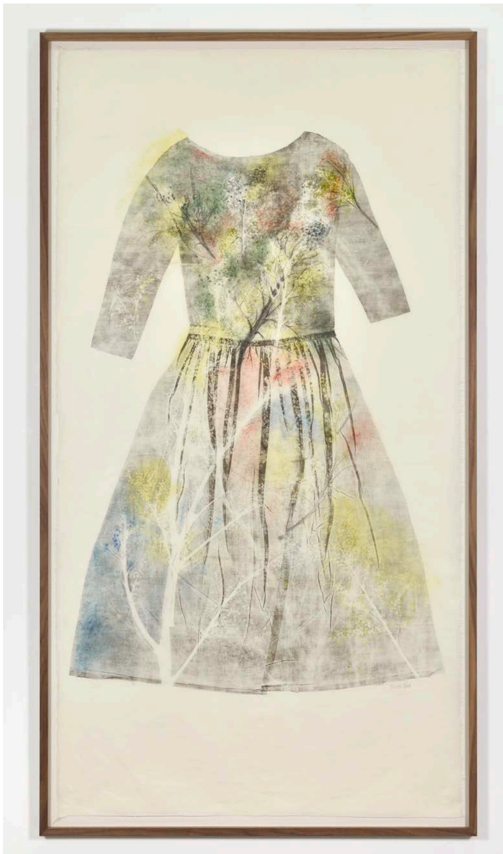
Eloïse Van der Heyden Dreams #5 , 2018 monotype sur papier coréen | 140 x 75 cm 4 500 €