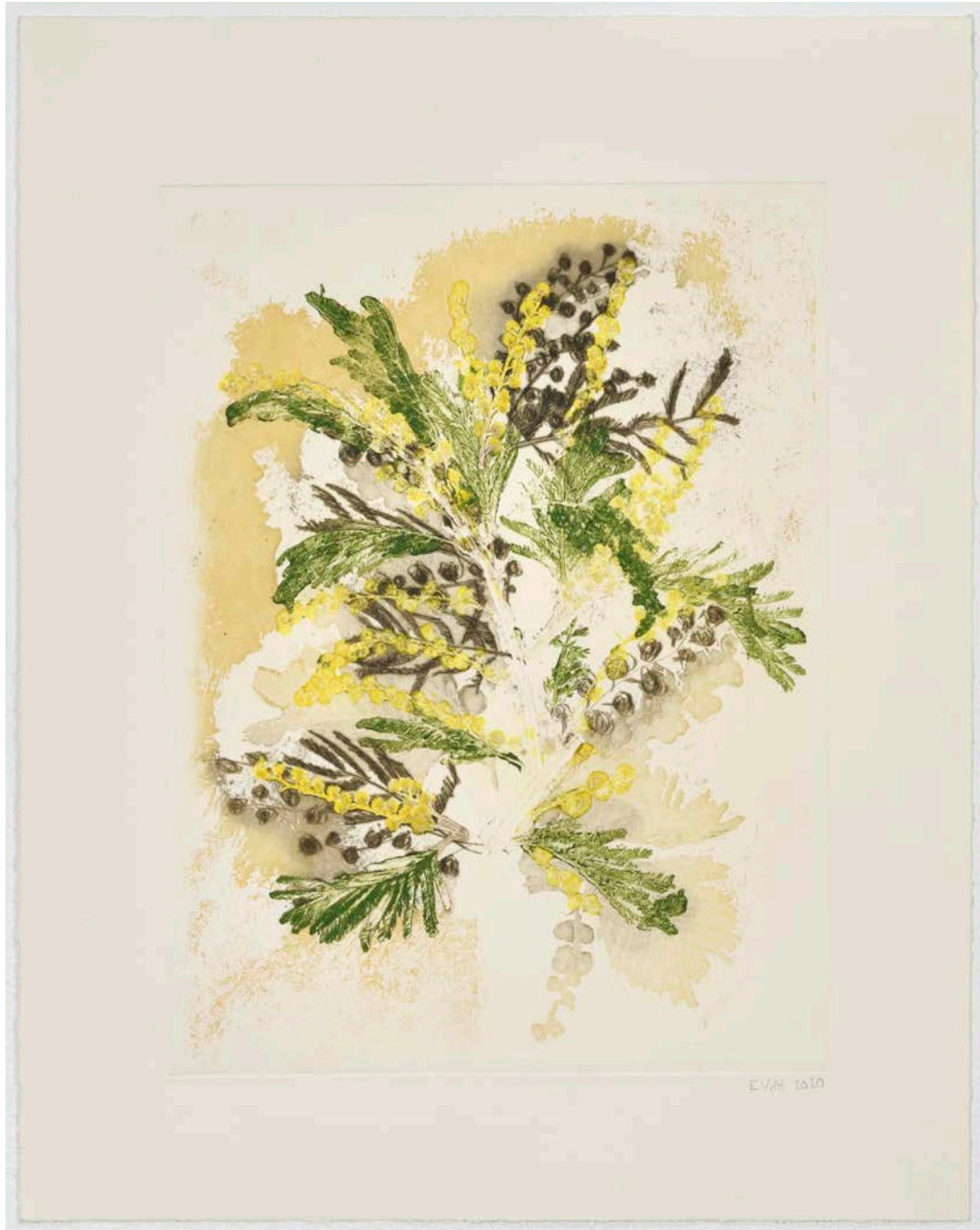
Eloïse Van der Heyden Mimosa #15, 2020 monotype | 53,8 x 42 cm 1 600 €