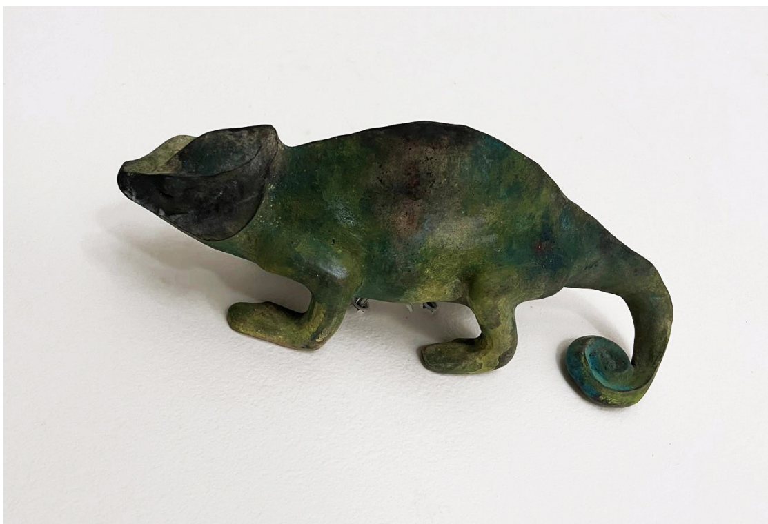
Eloïse Van der Heyden Caméléon , 2026 céramique enfumée, jus d'oxyde et pigments | 34 x 15 x 19 cm 3 500 €