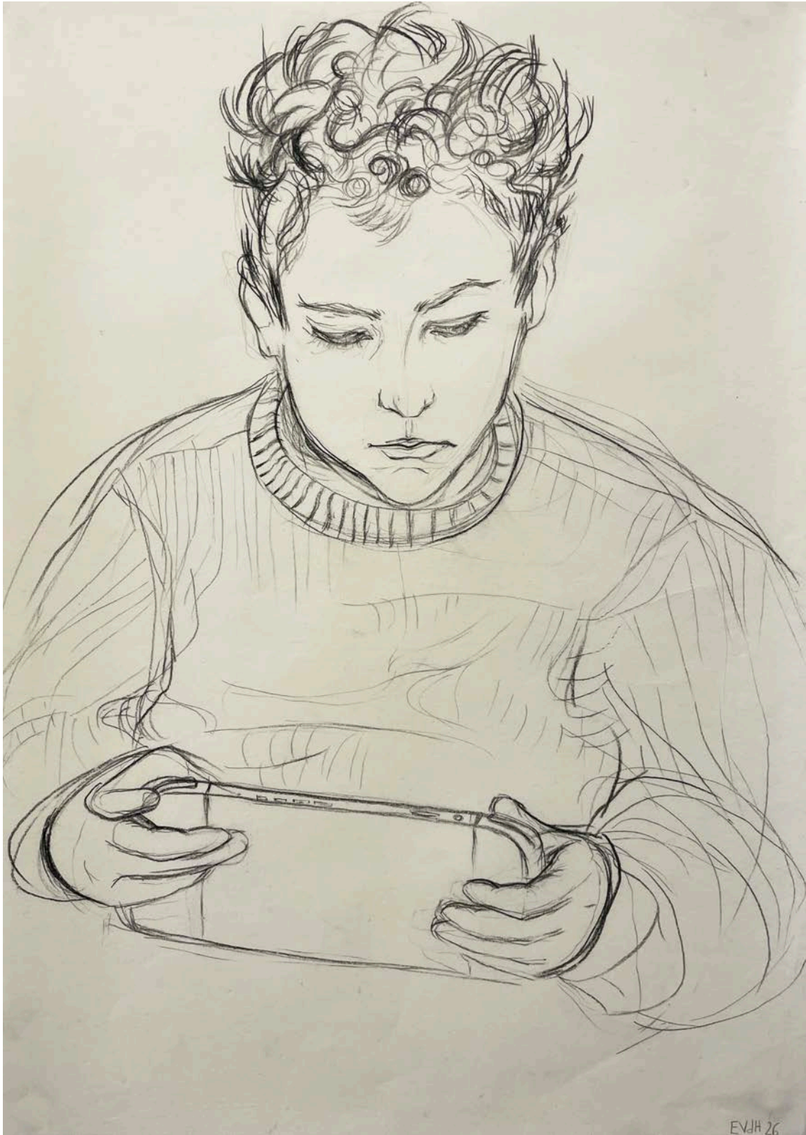
Eloïse Van der Heyden Joaquim , 2026 pierre noire sur papier | 71 x 50 cm 2 500 €