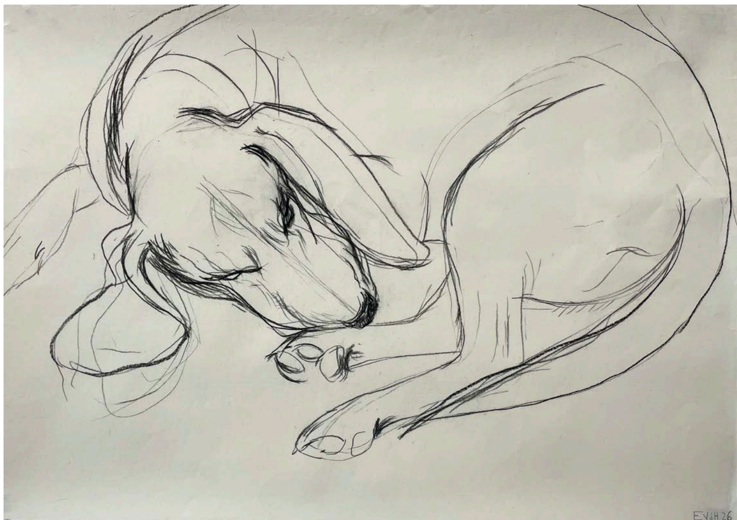
Eloïse Van der Heyden Chien couché #1 , 2026 pierre noire sur papier | 50 x 71 cm 2 500 €