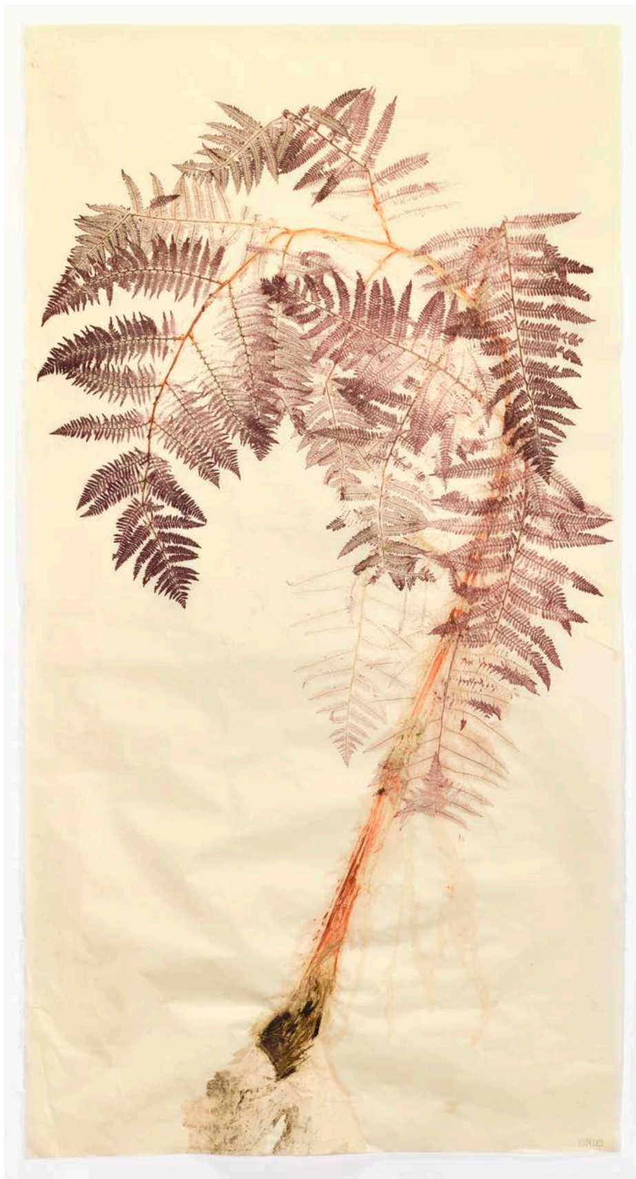
Eloïse Van der Heyden Fougère , 2022 monotype sur papier coréen | 188 x 99 cm 9 000 €