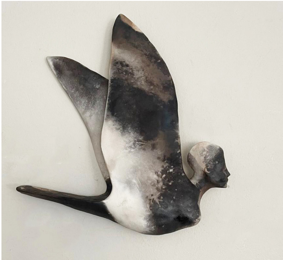
Eloïse Van der Heyden Sirène , 2026 céramique enfumée | 37 x 35 x 6 cm 3 800 €