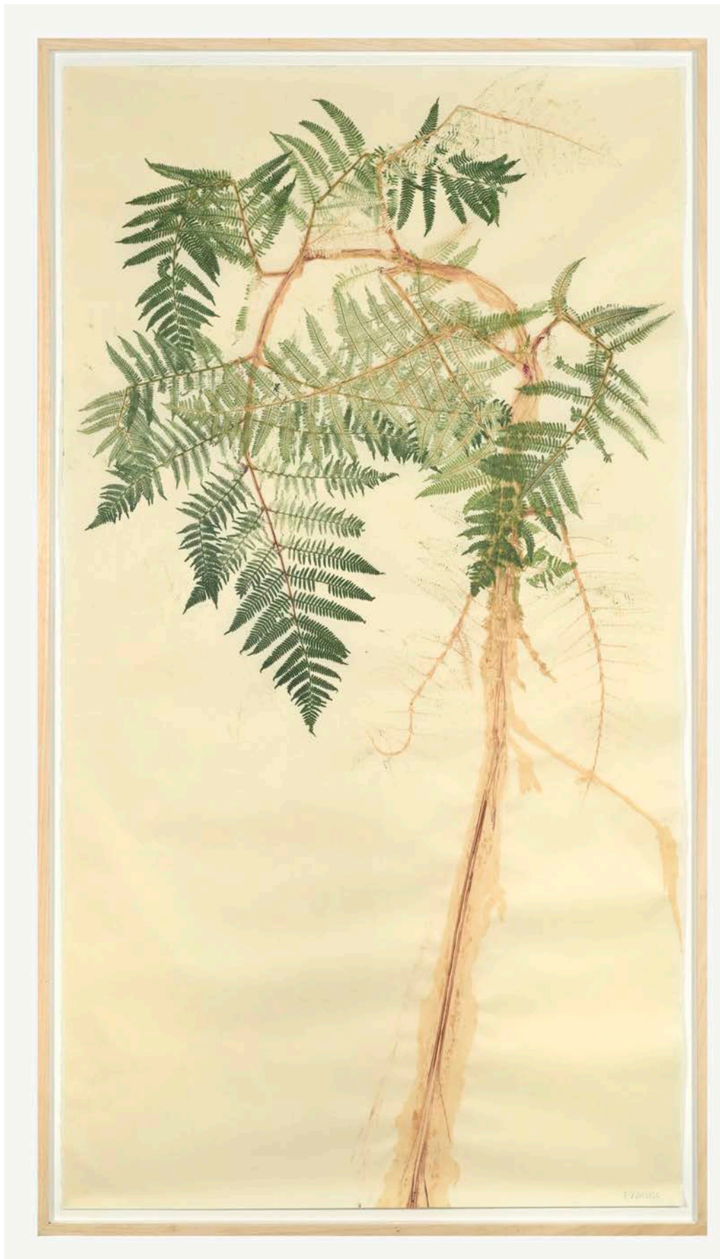
Eloïse Van der Heyden Fougère , 2026 monotype sur papier coréen | 188 x 99 cm 9 000 €