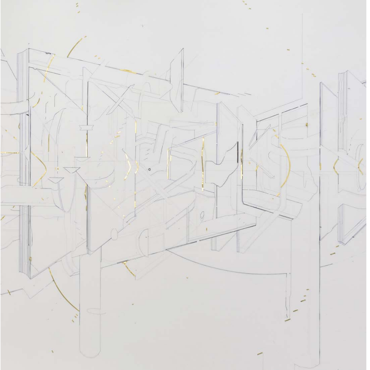
Keita Mori (détail de l'installation) / Exposition "Templates" à la galerie Catherine Putman