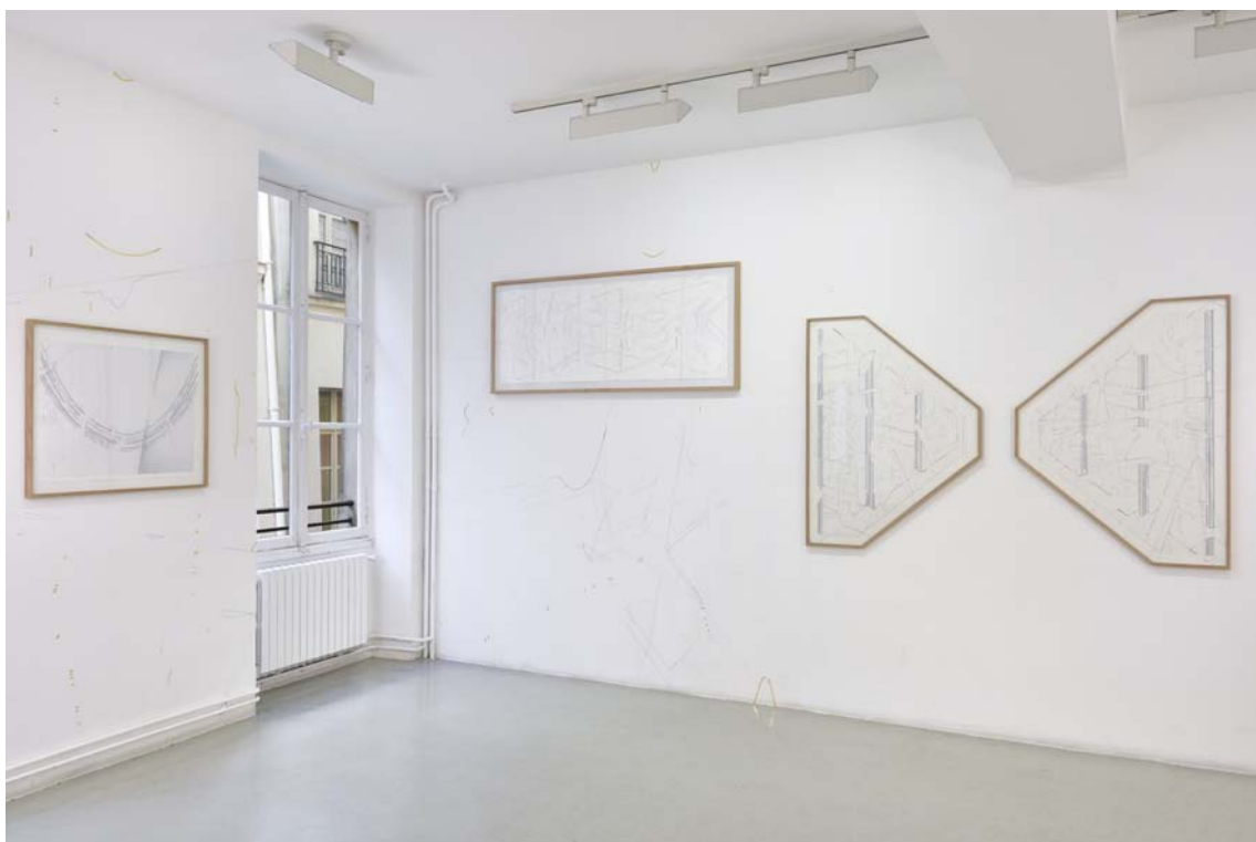
Keita Mori vue de l'exposition "Templates" à la galerie Catherine Putman