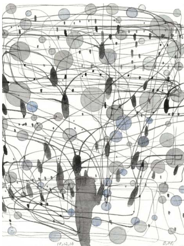
Bernard Moninot «Lignes d'erre_18.12.16», 2016 graphite, lavis d'encre de Chine et aquarelle sur papier 18 x 14 cm