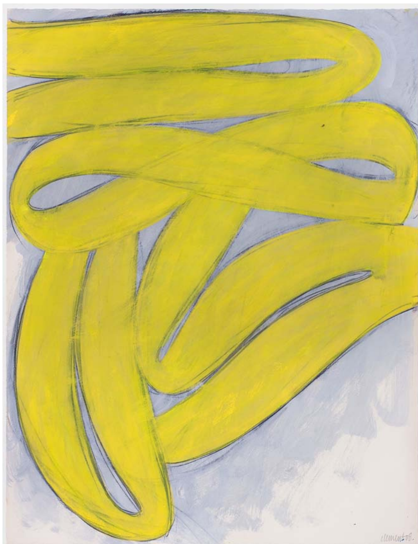
Alain Clément «sans titre» (08JA2A), 2008 gouache et fusain sur papier 65 x 50 cm