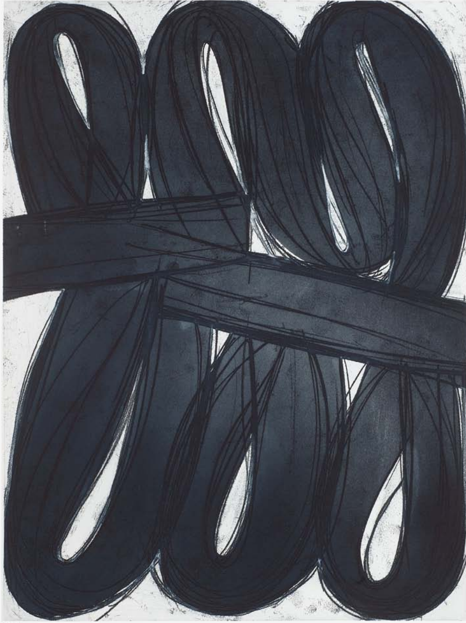
Alain Clément «sans titre», 2009 | aquatinte et vernis mou | 81 x 61 cm | 19 épreuves | Éditions Galerie Catherine Putman