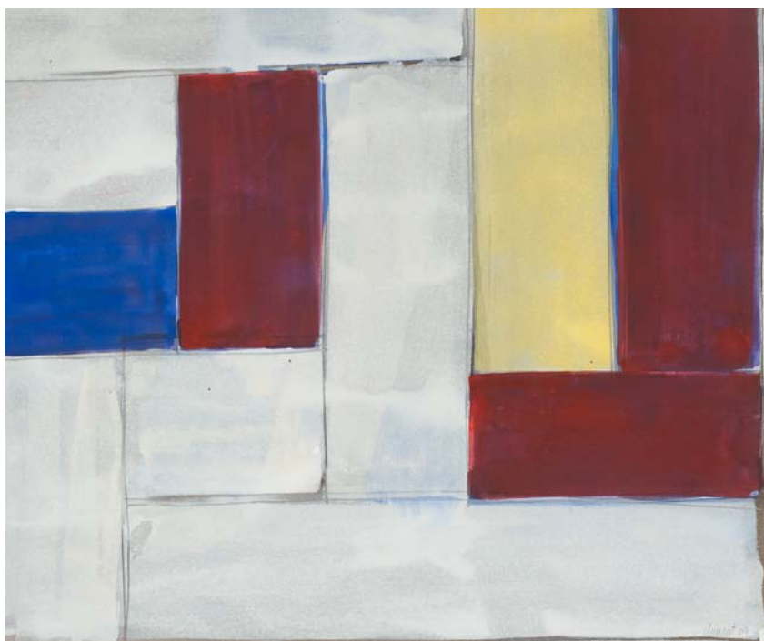
Alain Clément «sans titre» (04F7A), 2004 gouache et fusain sur papier 50 x 65 cm