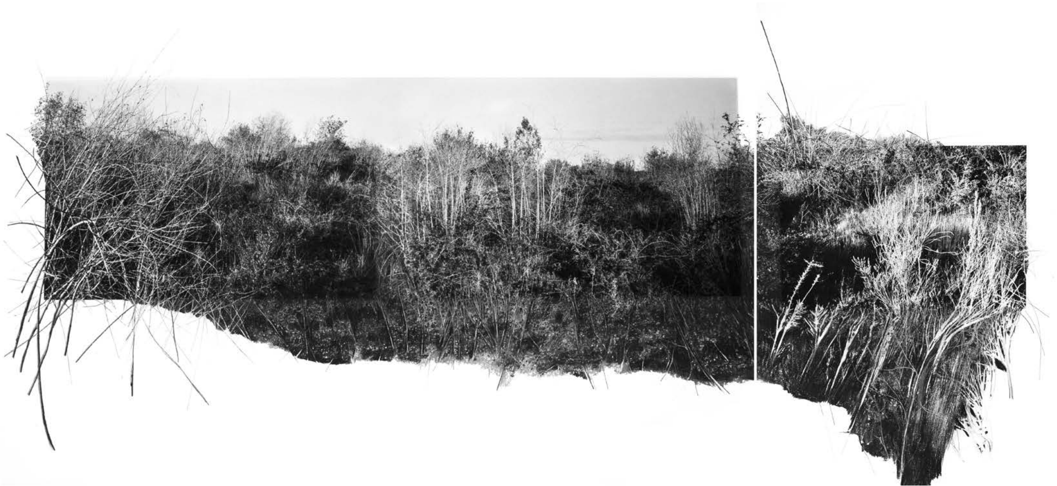
Dana Cojbcu Sans titre , 2023 | tirage pigmentaire, fusain et pastel sec | 70 x 150 cm (diptyque)