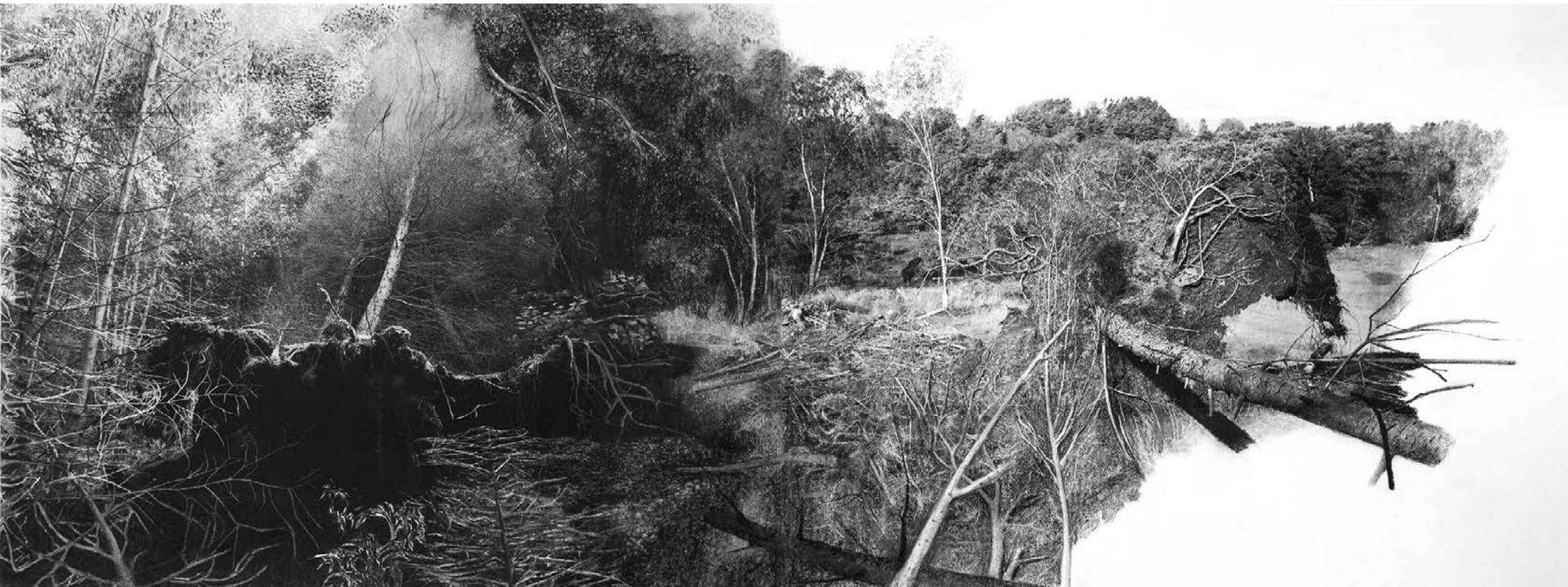
Dana Cojbu Yggdrasil #1 , 2023 | tirage pigmentaire, fusain et pastel sec | 30 x 80 cm