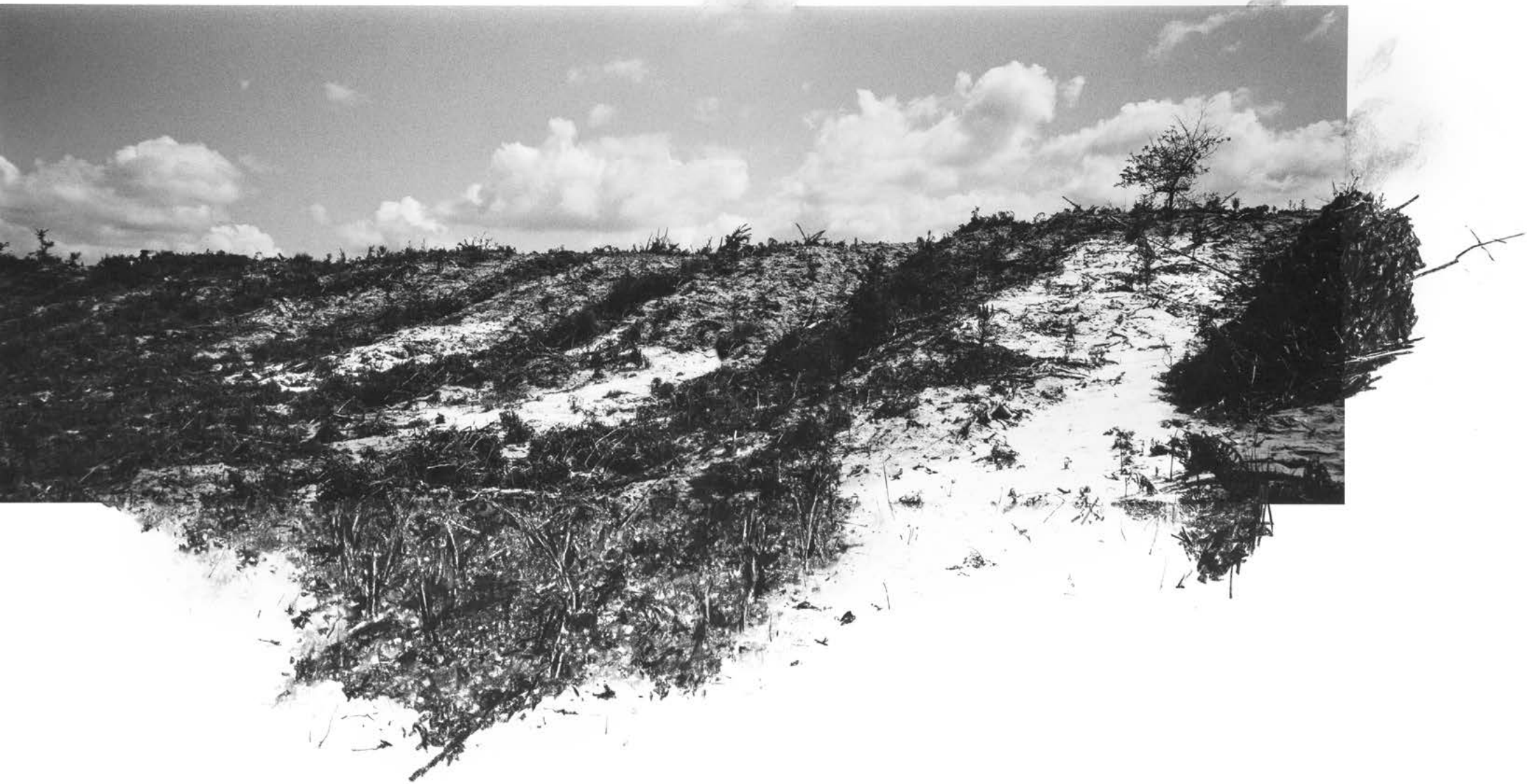
Dana Cojbc Sans titre , 2023 | tirage pigmentaire, fusain et pastel sec | 40 x 55 cm