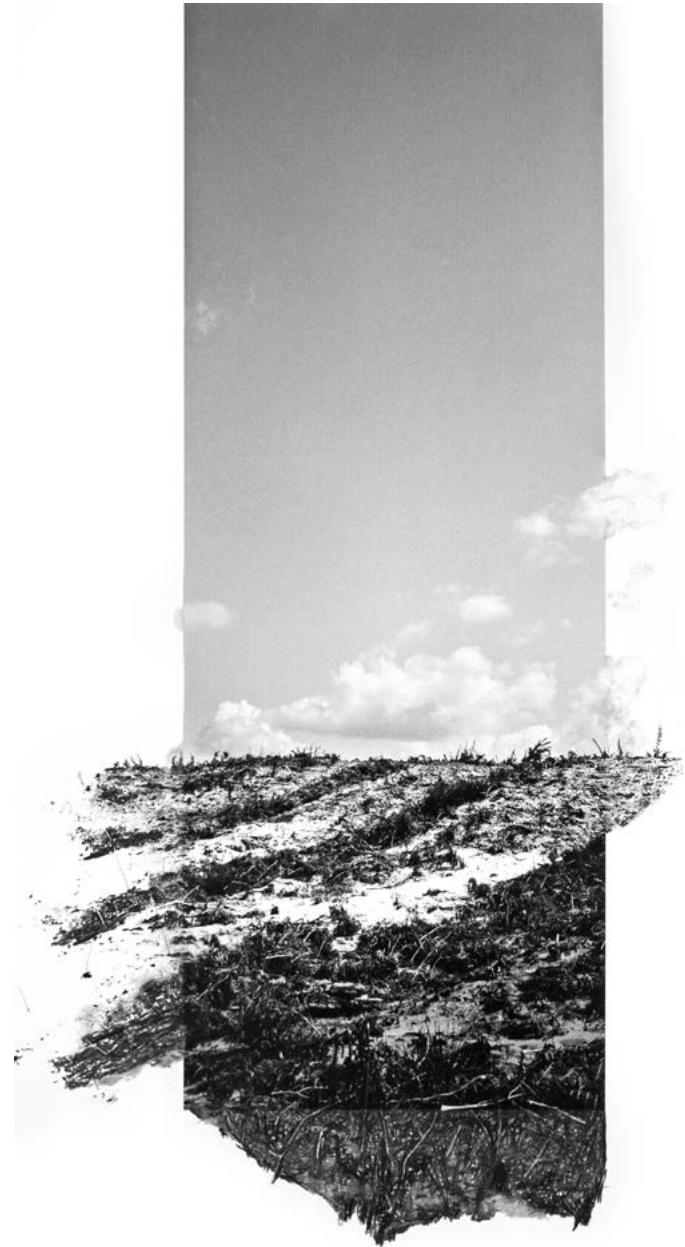
Dana Cojbcu Sans titre , 2023 | tirage pigmentaire, fusain et pastel sec | 95 x 50 cm (page de droite)